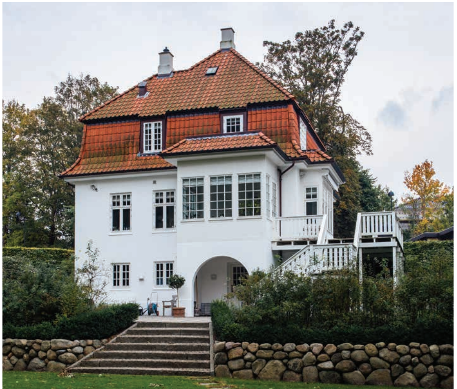
Villa i Holte tegnet af A. Kuld

Det sorte træhus fra 1895 opleves med en egenart som er typisk for perioden. Huset fremstår flot proportioneret med fine detaljer. Huset er oprindeligt bygget i Norge og efterfølgende flyttet til Danmark, hvilket forklarer arkitektens norske udtryk.