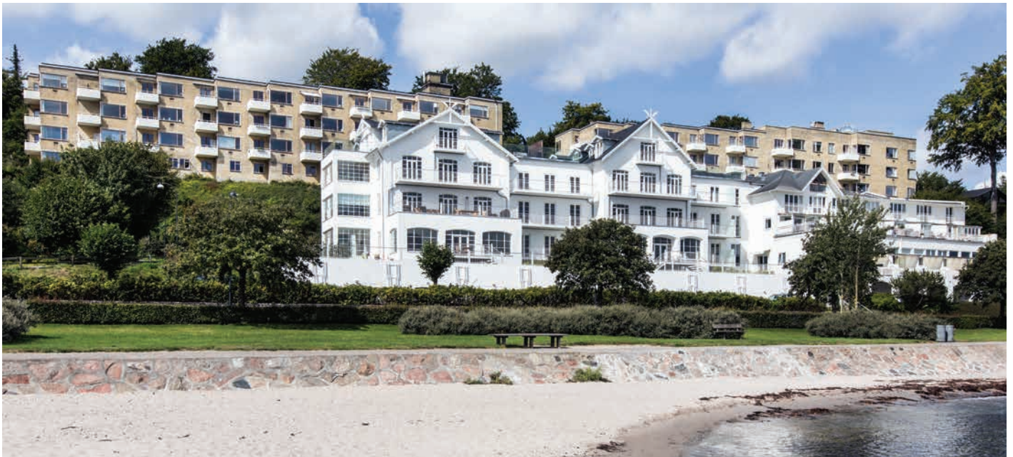
Høje Skodsborg tegnet af A. Wittmaack og V. Hvalsøe og badehotellet Skodsborg Søbad.