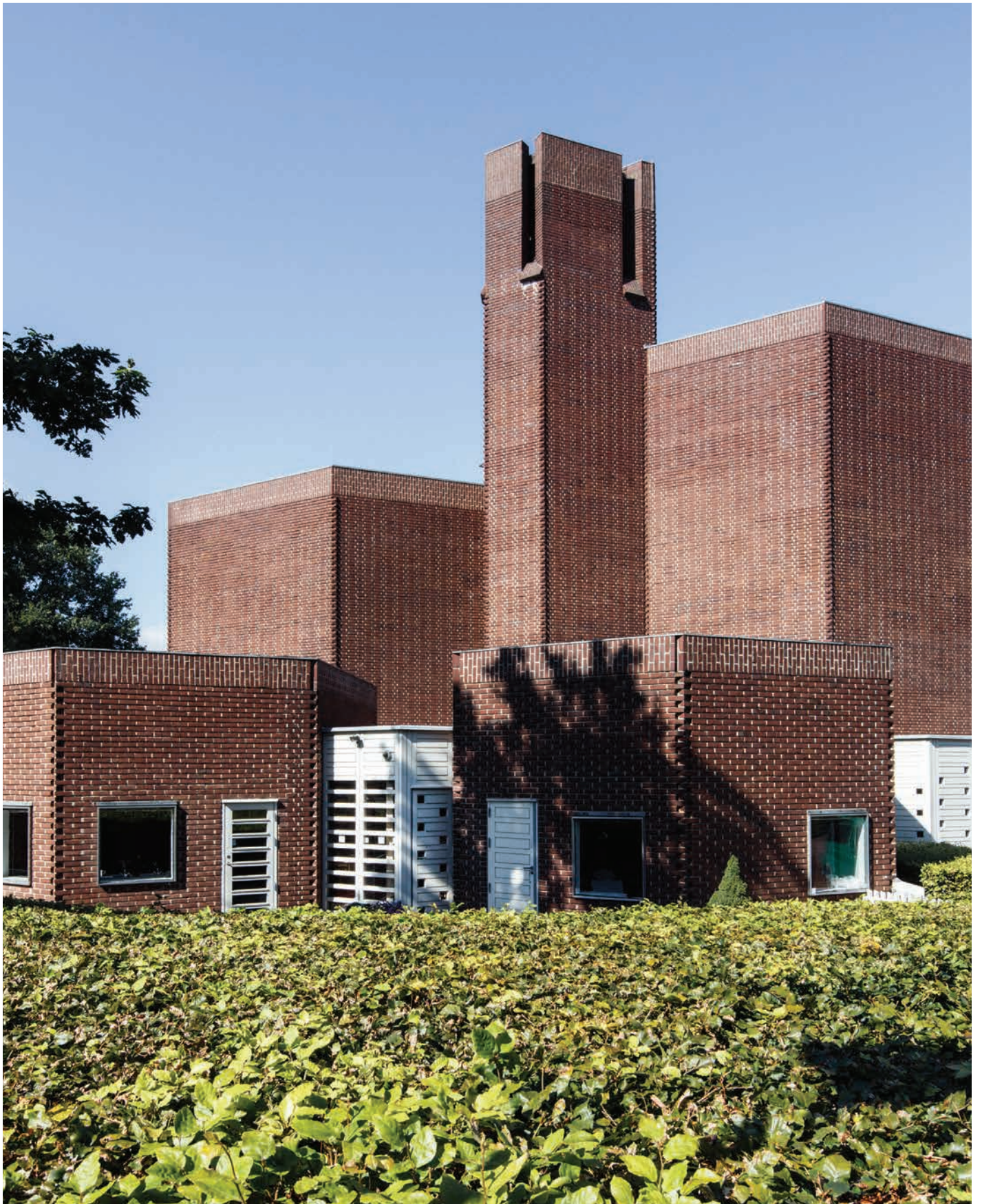
Gl. Holte Kirke tegnet af Jørn Nielsen og Halldor Gunnløgsson