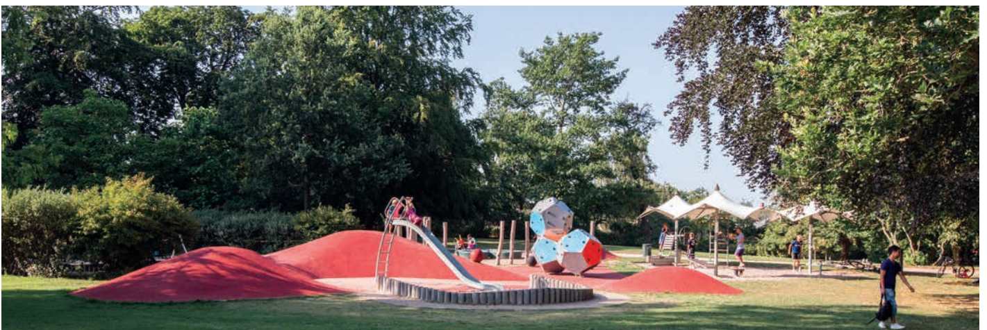
Cathrinelystparken i Birkerød

Fælles for stationsforpladsen i Holte og Cathrinelystparken er, at områderne er skabt med henblik på at skabe attraktive mødesteder.