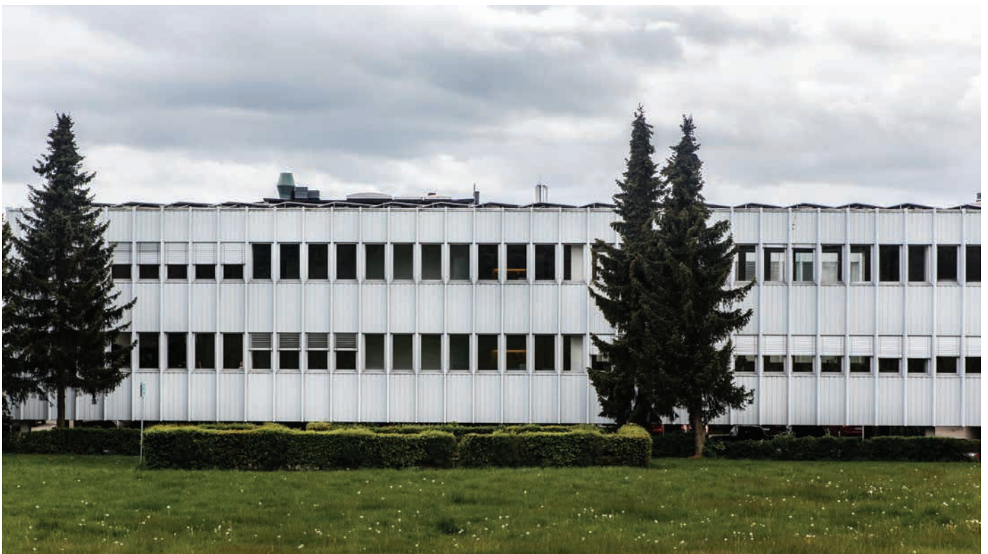
Teknikerbyen i Søllerød tegnet af Krohn og Hartvig Rasmussen