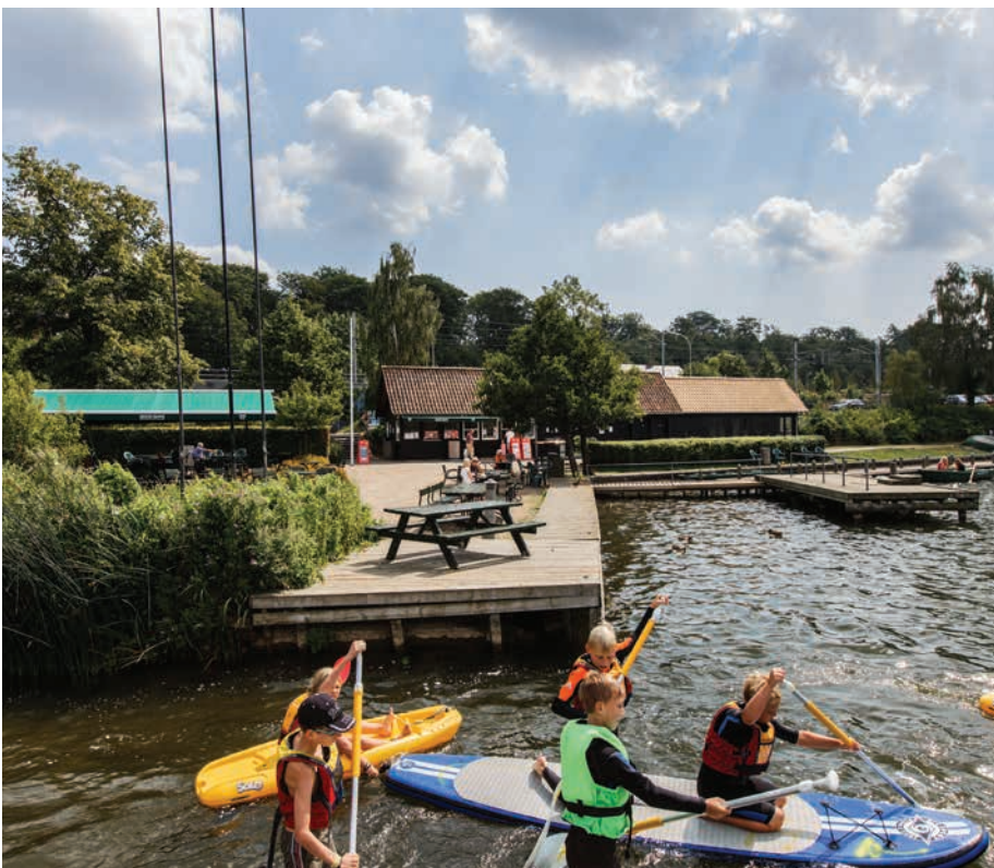
Leg i Holte Havn

Mange søer i kommunen er med til at give udsyn og luft for de tilgrænsende boligområder, men det kræver også hensyntagen at have en grund, der grænser op til en sø.