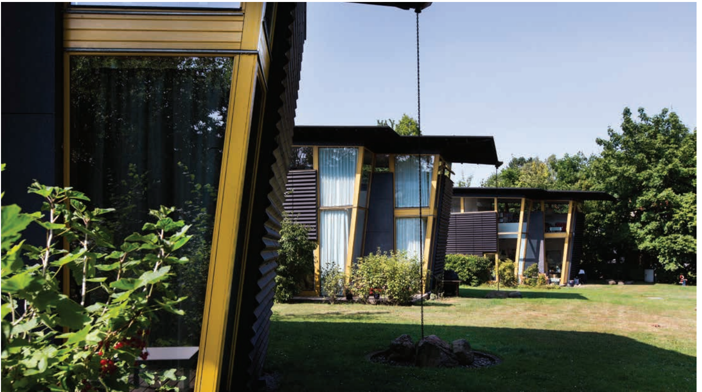
Boligbebyggelse ved Birkerød Sø tegnet af Vandkunsten