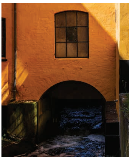
Vandmøllen på Nymølle farveri