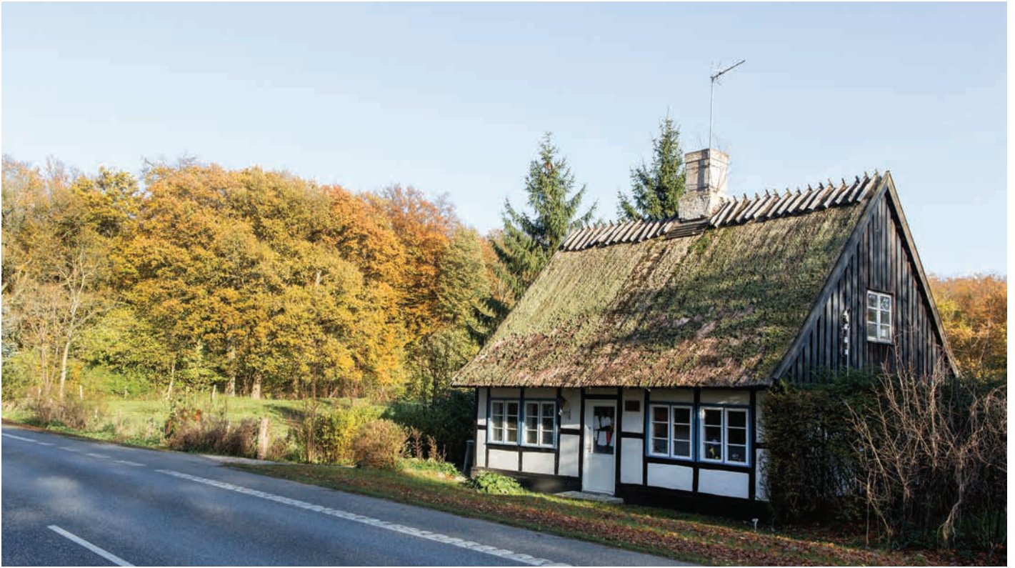
Rudehus ved Hørsholm Kongevej