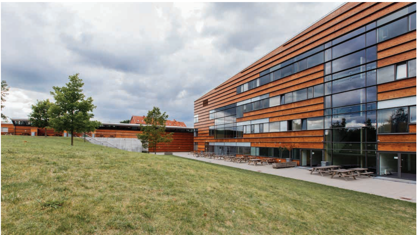
Nærum Gymnasium tegnet af Dall og Lindhardtsen