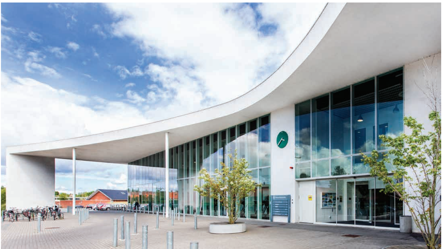
Birkerød Idrætscenter tegnet af Schmidt Hammer Lassen