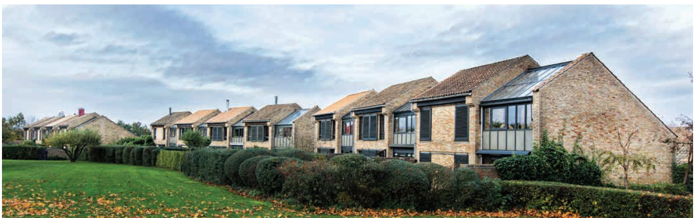
Gassehaven i Gl. Holte tegnet af Palle Suenson

Begge bebyggelser er sårbare overfor forandring, fordi de er opført med et stramt og klart arkitektonisk formsprog, hvor bare det at male et dørparti i en anden farve vil forandre oplevelsen væsentligt.