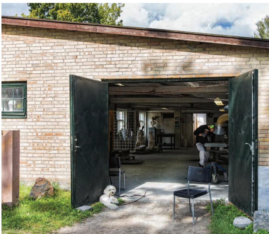
Erhverv i Raadvad

I den store skala er der brug for repræsentative byggerier i en mere styret arkitektur, mens der i den lille skala er plads til en variation, som understøtter hverdagslivet.