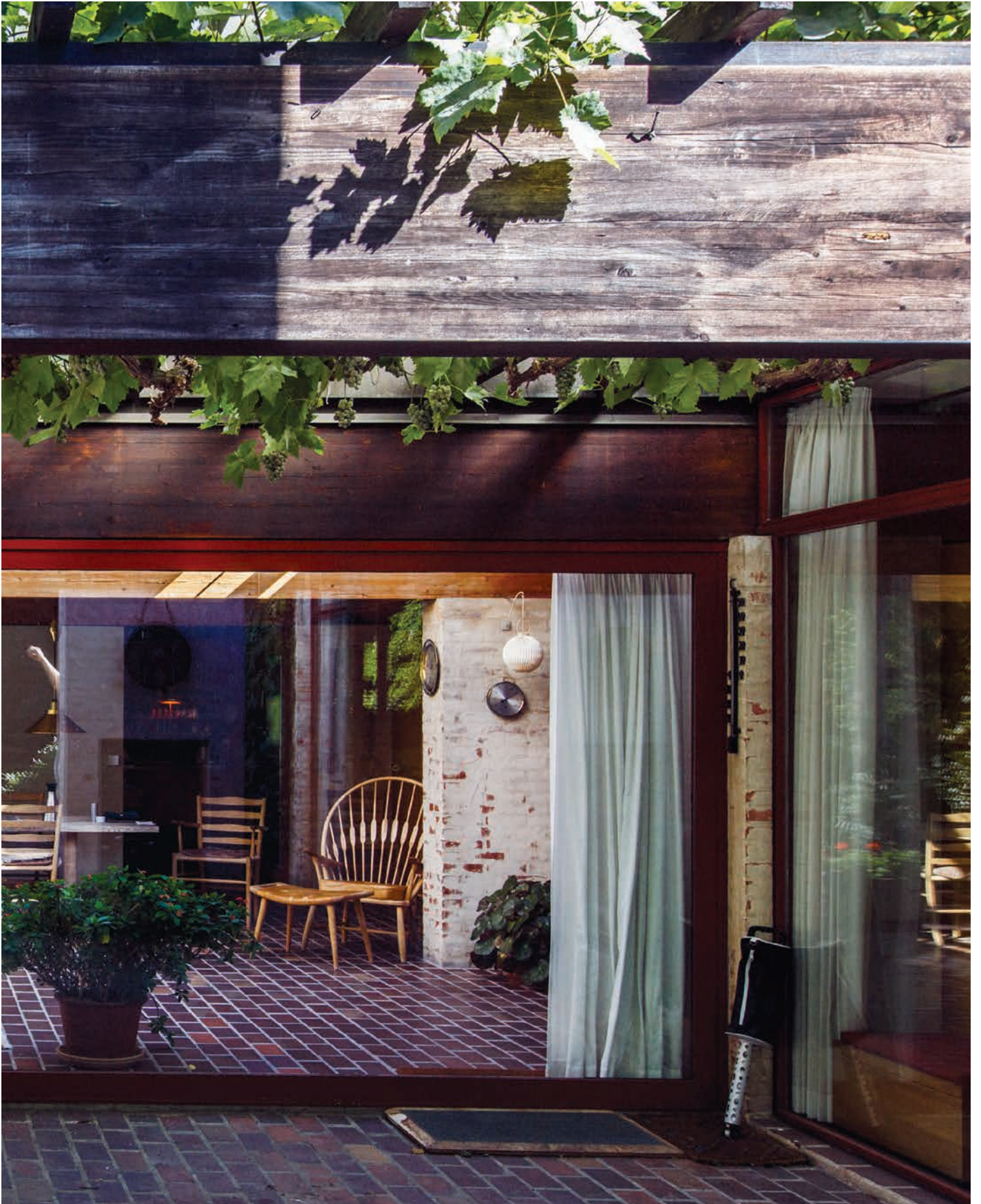
Parcelhus i Holte tegnet af Jørn Utzon