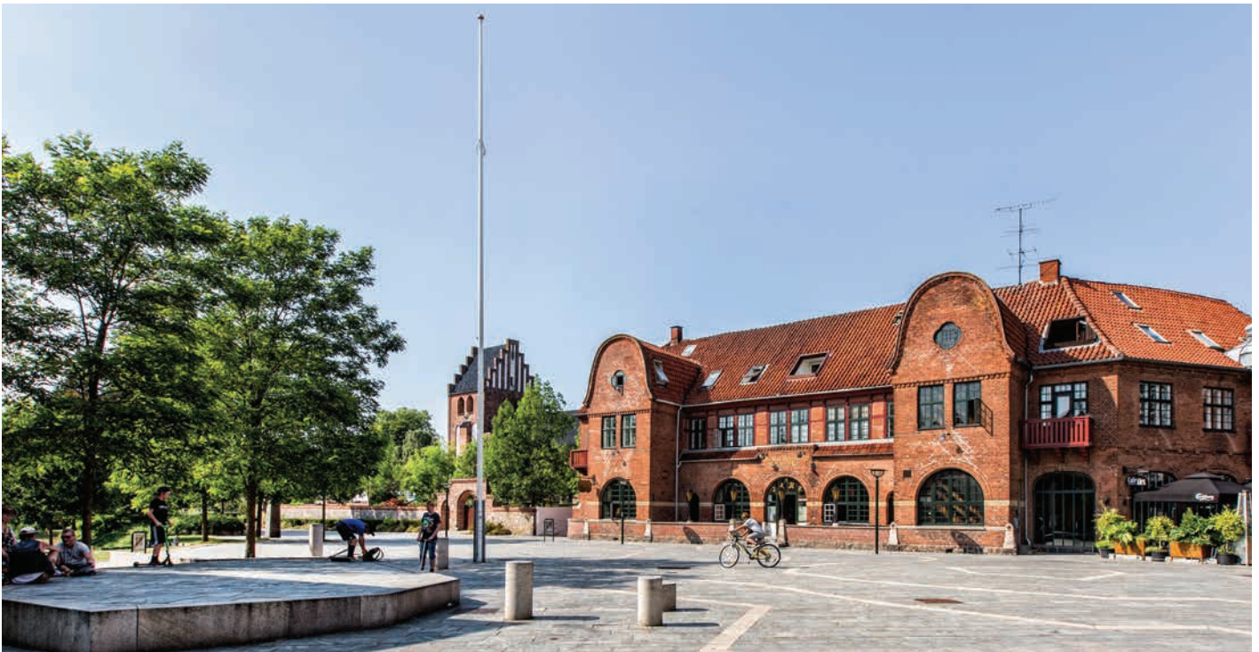
Majpladsen i Birkerød