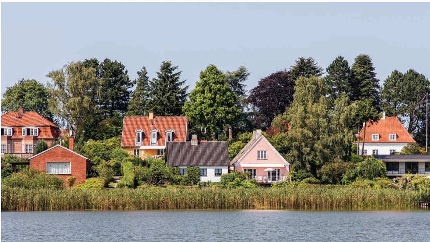
Huse beliggende omkring Birkerød Sø

leves i og omkring dem. Her må vi gerne have en ambition om, at disse bygninger fremstår som gode eksempler og med en generøsitet, som giver plads til mere end bare den primære funktion.