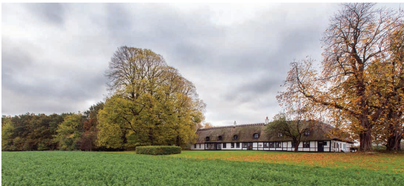
Rygaard ved Søllerød Naturpark