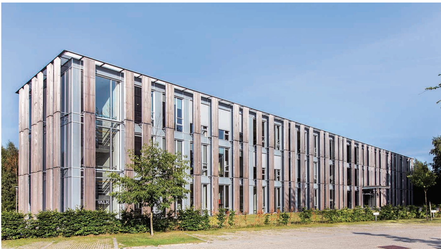
Bøge Allé 1 i Scion DTU tegnet af Jørn Langvad