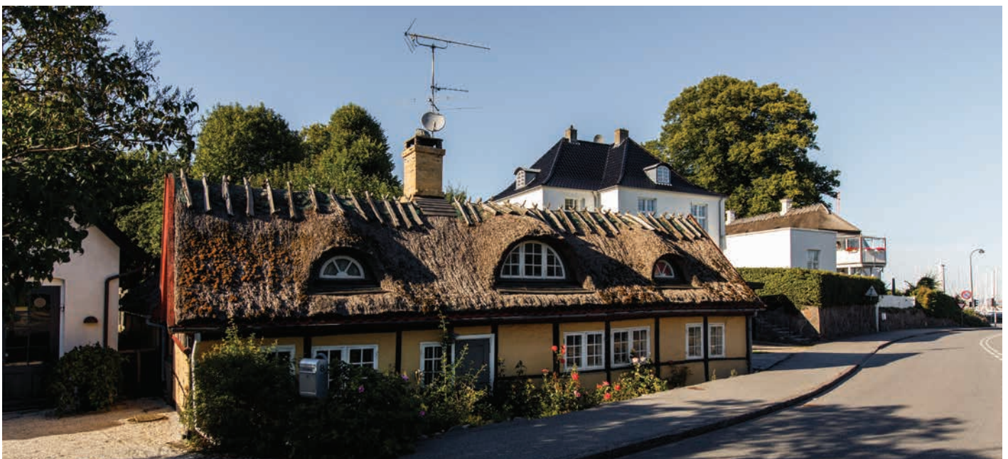
Oprindeligt fiskerhus på Trørødvej 6

Fælles for begge bebyggelser er, at de i deres skala og udtryk forstærker oplevelsen af kystens variation.