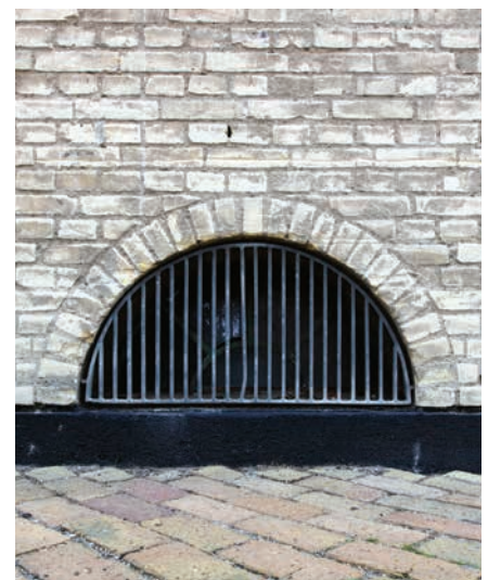
Detalje Nærum Vænge