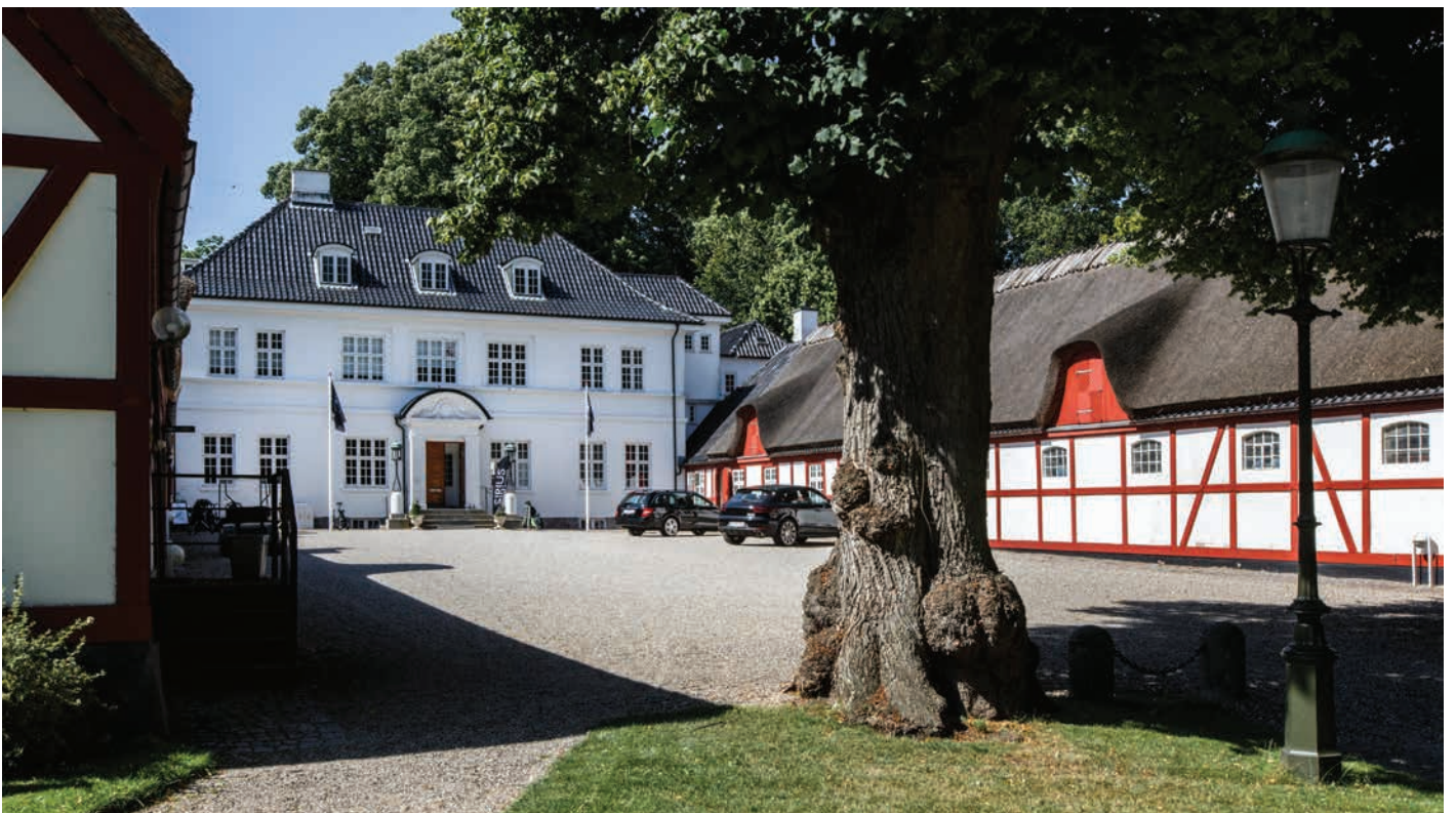
Hestkøbgård i Bistrup. Hovedbygningen er tegnet af A.J. Prior