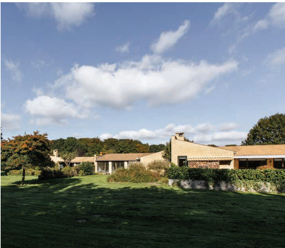
Højbjerg Vang i Holte tegnet af Palle Suenson

Kommunens grønne kiler snor sig ofte ind mellem bebyggelse og kommer flere steder tæt på kommunens indkøbscentre, skoler og andet.