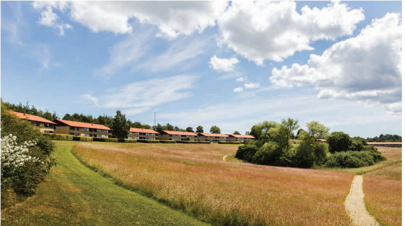
Nørrevang i Birkerød tegnet af Henning Jensen og Torben Valeur