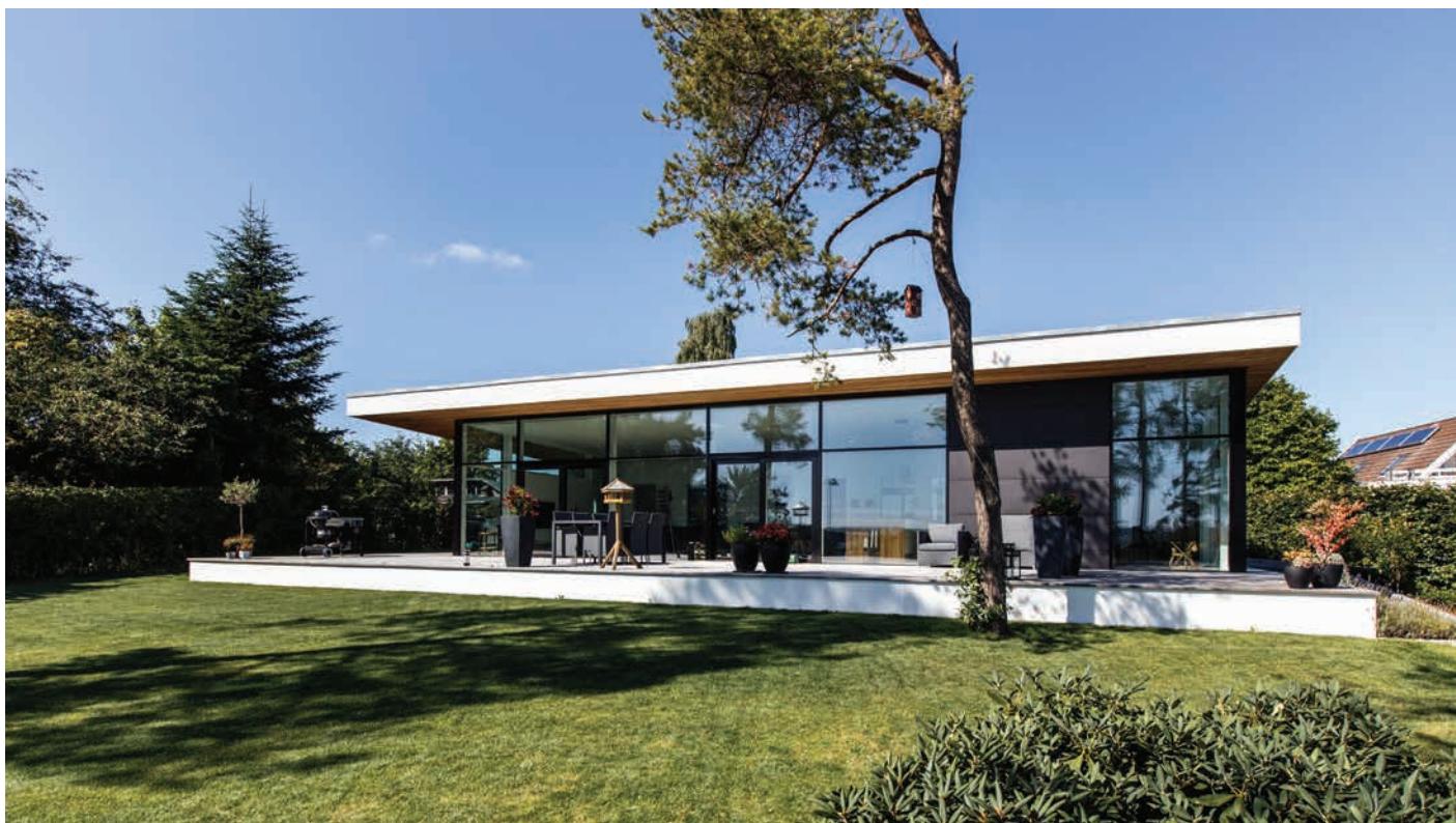
Vinder af arkitekturprisen i 2013 tegnet af TNT arkitekter

Rudersdal Kommune ønsker en fortsat dialog omkring god arkitektur.