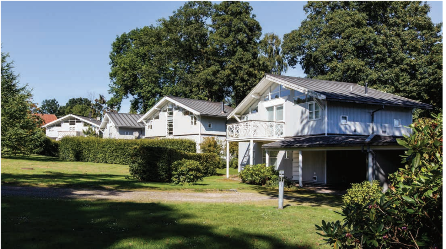
Rønnebærtøften tegnet af Tage Lyneborg