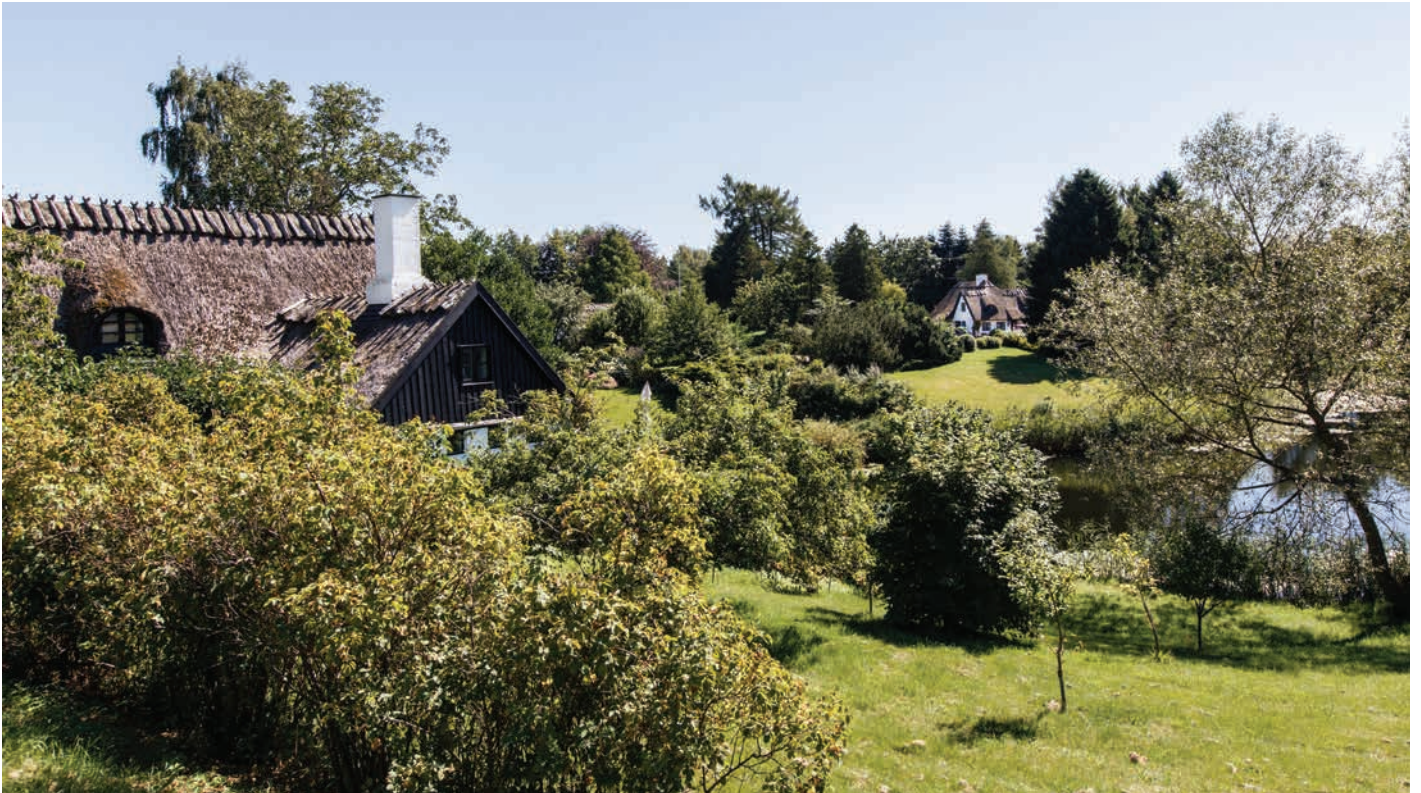
Gårde og husmandssteder omkring Sænkesø i Høsterkøb