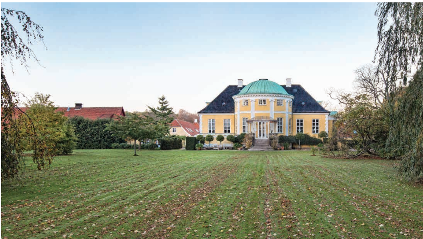
Frydenlund i Trørød, oprindeligt tegnet af J.C Krieger