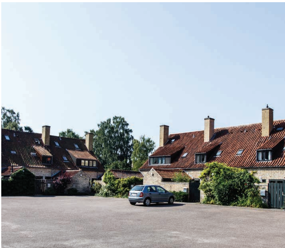
Parcelgården i Holte tegnet af Palle Suenson

I 1950 igangsattes en forstadsudbygning af kommunen med en række fremtrædende arkitekter. Det skabte grundlag for en række værdifulde bebyggelser, skabt med blik for gentagelse og rytme.