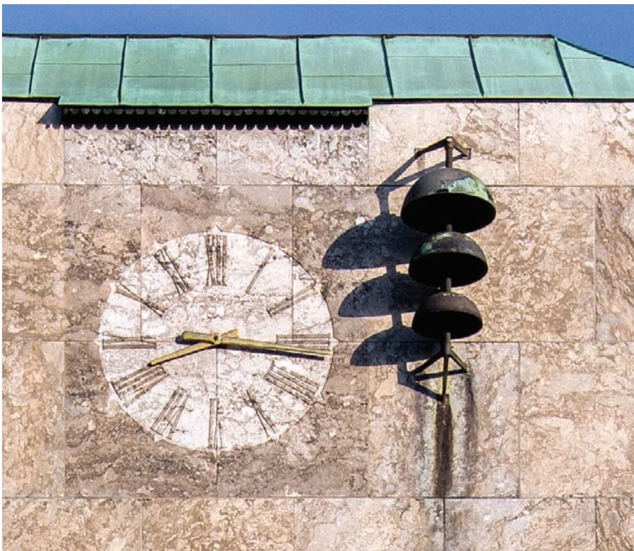
Urværket på rådhuset