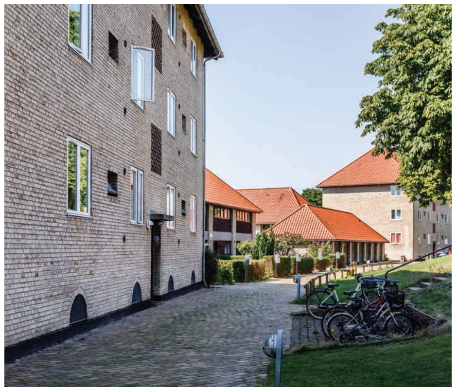
Nærum Vænge tegnet af Palle Suenson

Nærum Vænges almene bebyggelse er tegnet af arkitekt Palle Suenson og opført i perioden 1949 til 1961. Kompositionen af rækkehuse og etageboliger, der bindes sammen af røde tegltage, og facader i gule tegl, som går igen i bebyggelsens belægninger på udearealerne skaber et helstøbt miljø med en meget menneskelig skala. Området er udpeget som kulturmiljø.