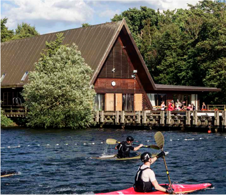
Holte roklub tegnet af Krohn og Hartvig Rasmussen

Idrætsanlæg er ofte opført i forskellig arkitektonisk stil og udviklet over tid. Mange anlæg er tegnet og bygget af brugerne.