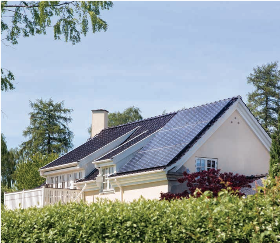
Villa i Birkerød

Ofte er det vanskeligt, at etablere solenergianlæg på eksisterende bygninger og særligt ældre bygninger med tegltage, da anlægget bryder med tegltagets udtryk, spejlinger, overflade og i enkelte tilfælde farver.