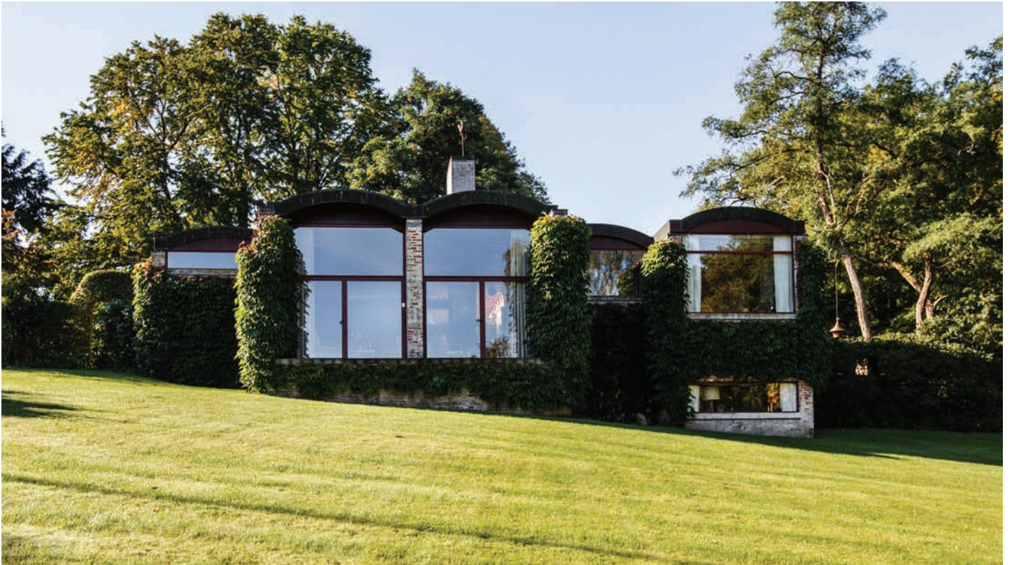
Villa ved Søllerød Naturpark tegnet af Gehrdt Bornebusch