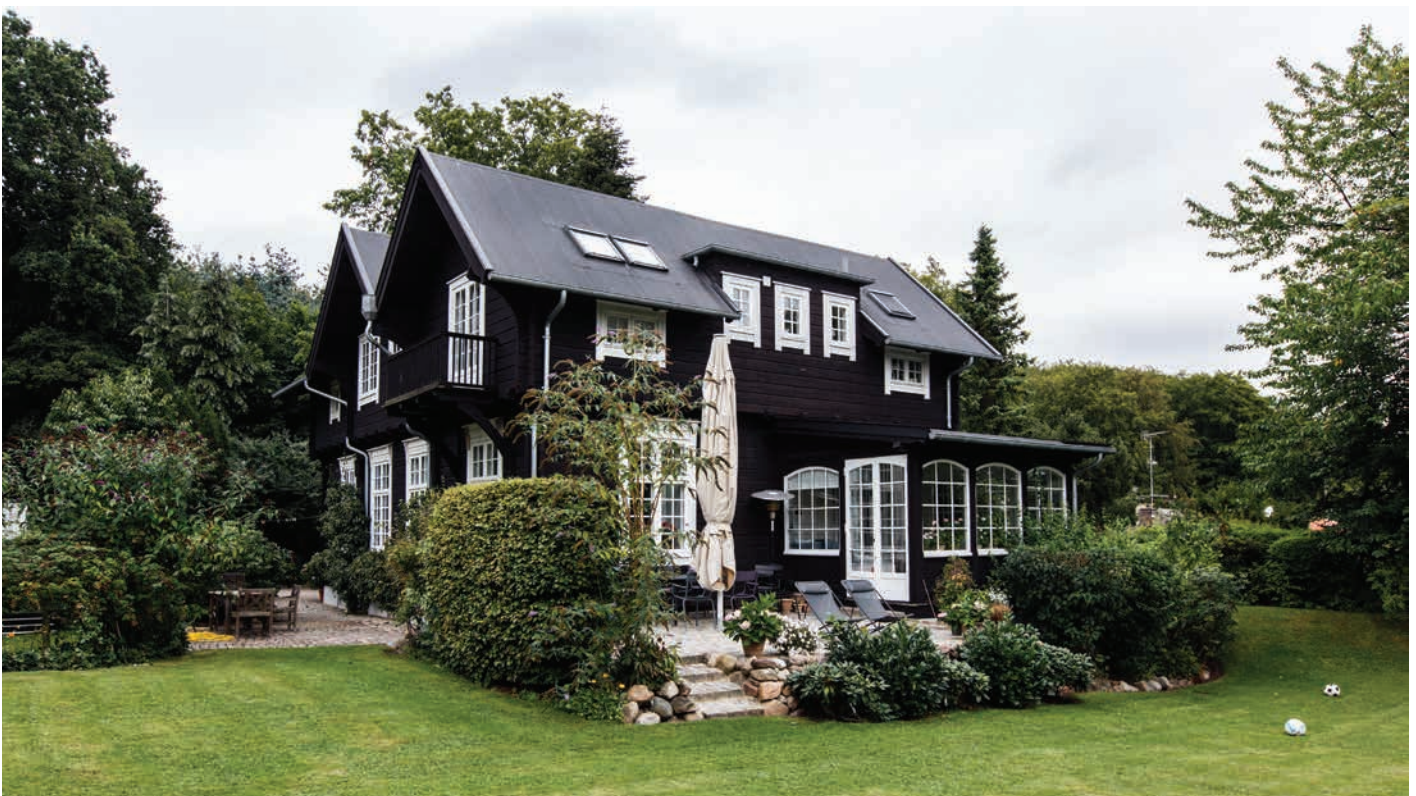
Villa i Trørød, Tilbygningen er tegnet af Niels Rosenkjær