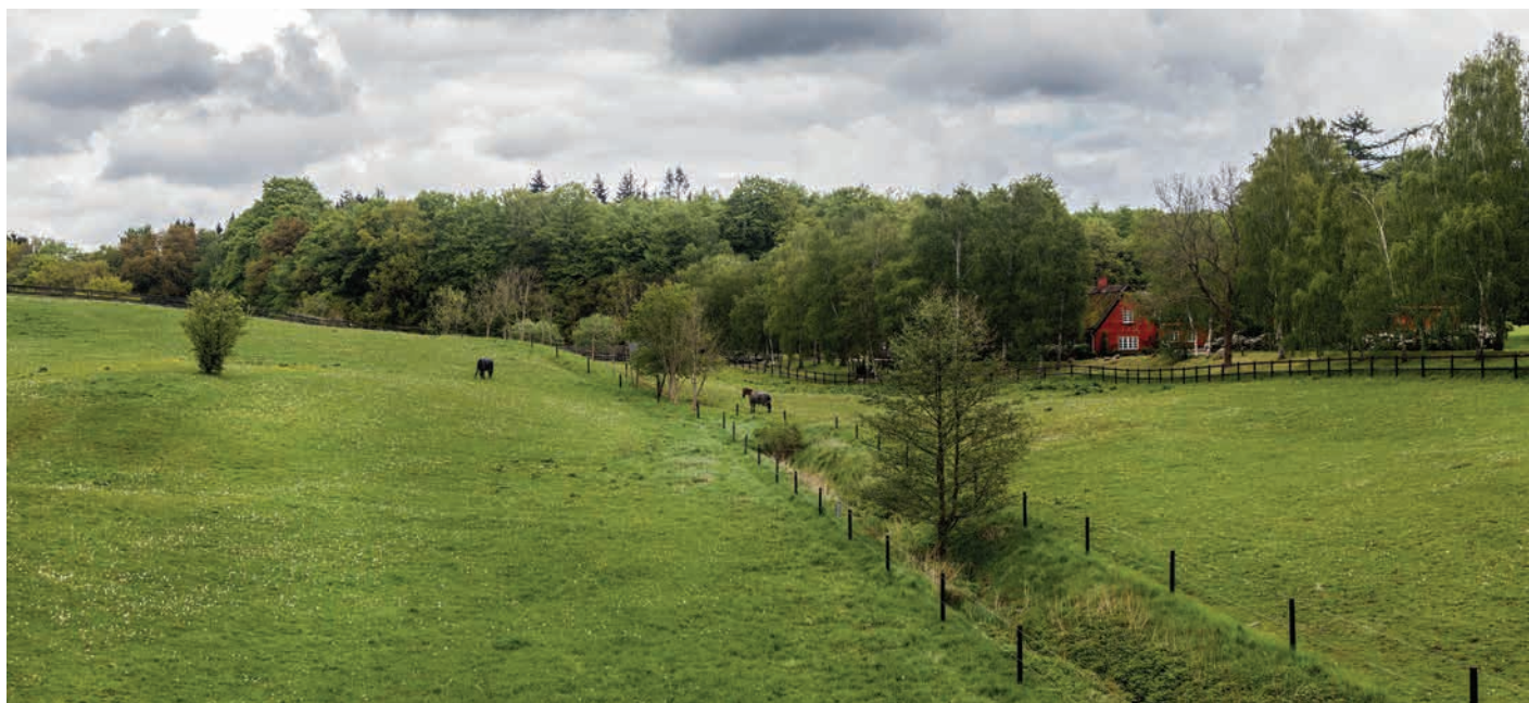
Skovrødgård ved Birkerød

Både Skovrødgård samt Rygaard er fine eksempler på, hvordan bebyggelsen og haveanlæg er nænsomt indpasset i landskabet. Rygaard flyder med sit åbne haveanlæg sammen med det omgivende landskab. Skovrødgård anvender hegn til afgrænsning af huset nærområde. Hegnene er afstemt med terrænet og understøtter herved oplevelsen af bakkedalen.