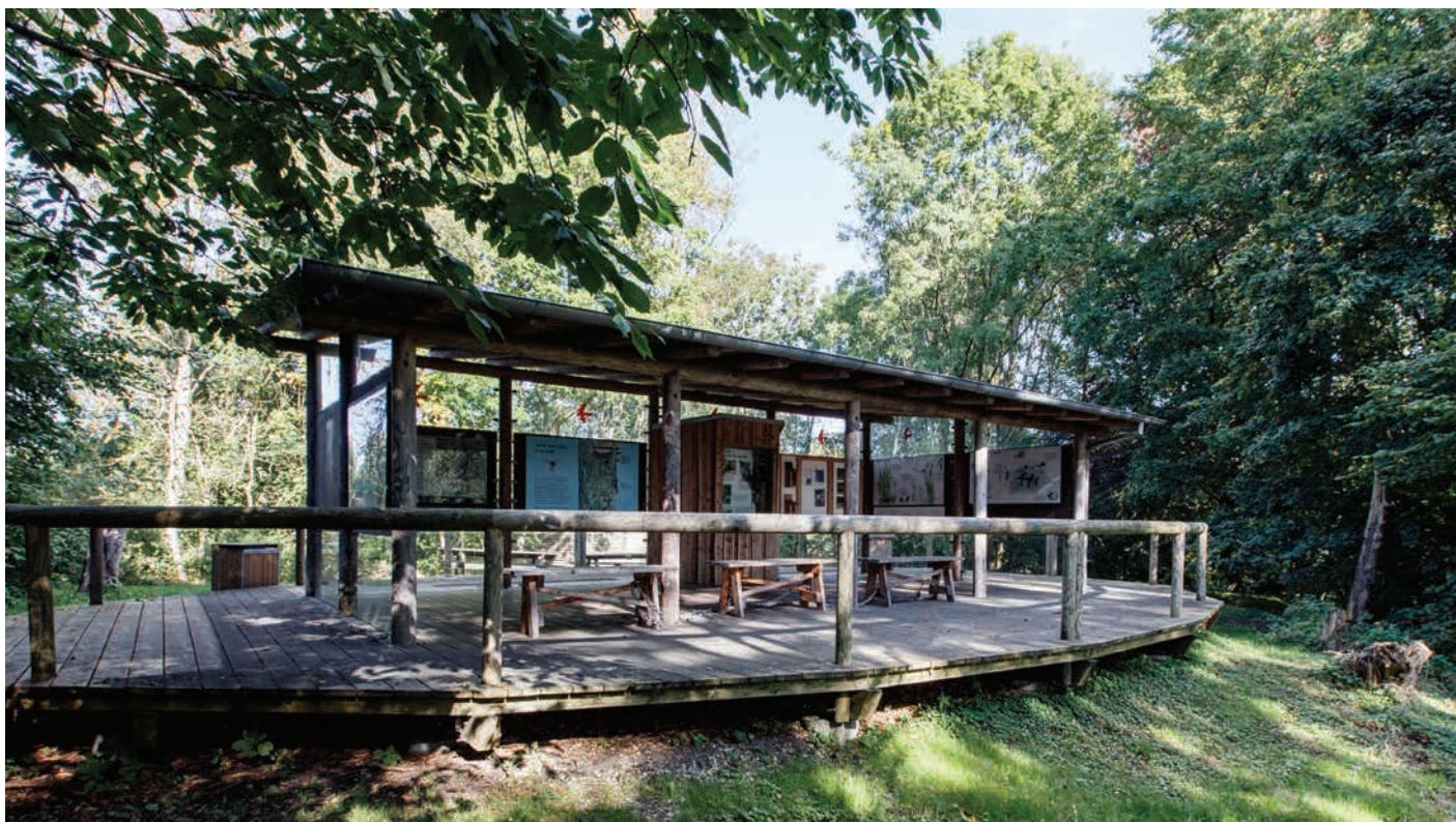
Formidlingspavillonen i Vaserne er i materialevalg og form smukt indpasset i naturen