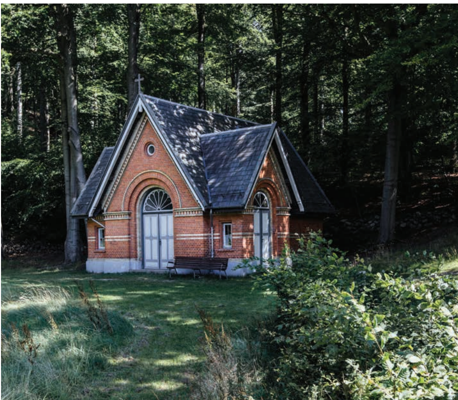
Kapellet i Ebberød

De store institutioner opført i perioden 1800-1920 er karakteriseret ved store monumentale bygningsværker, der adskiller sig fra den øvrige bygningsmasse. Helt særligt for kommunen er institutionsbyggerier i Ebberød, der med en samling af monumentale bygninger opført i perioden 1890-1920 skaber et unikt bymiljø. Bygningerne fremstår med en stor detaljerighed. Området er ligeledes i kommuneplanen udpeget som kulturmiljø.