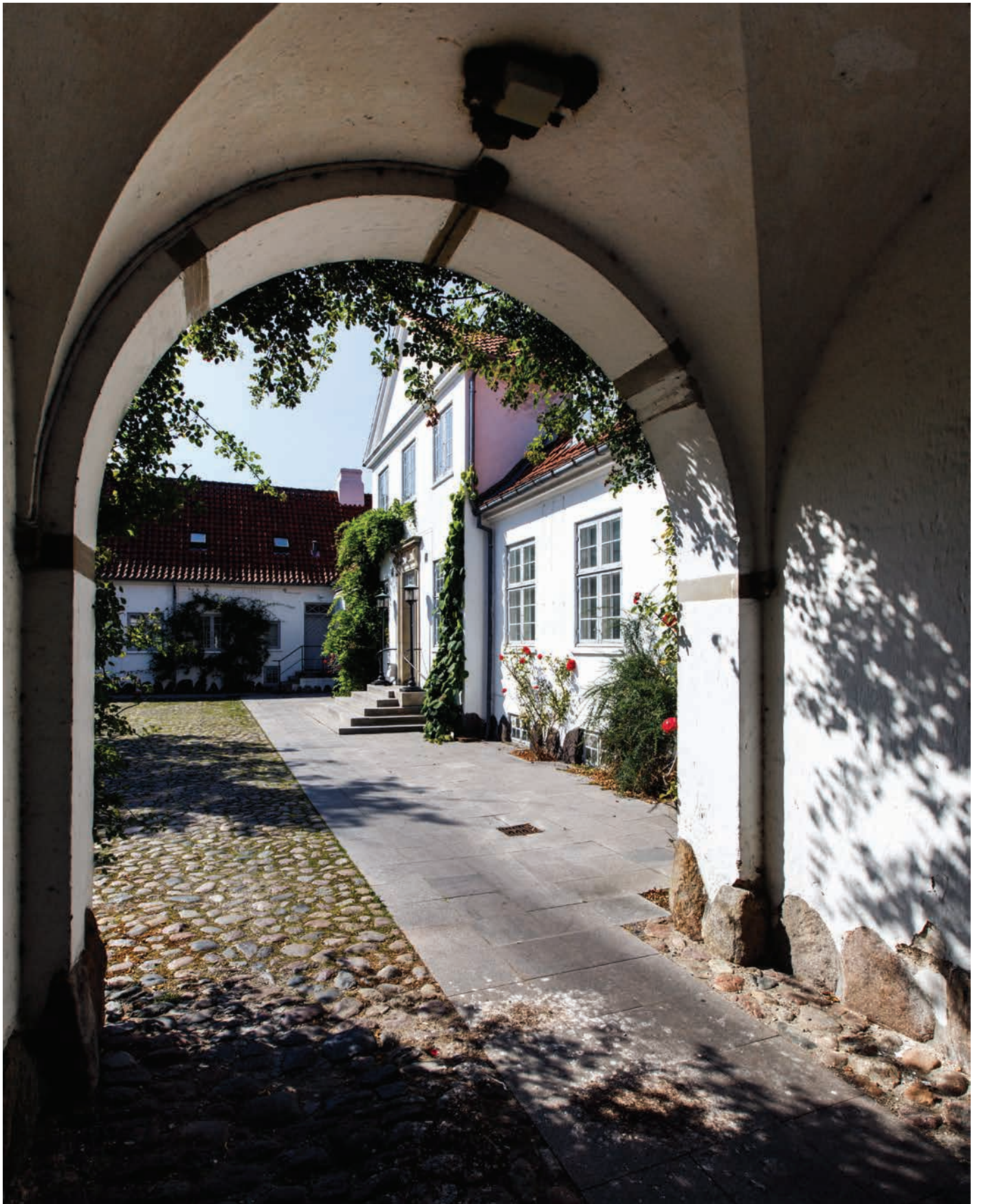
Nordvanggård i Bistrup