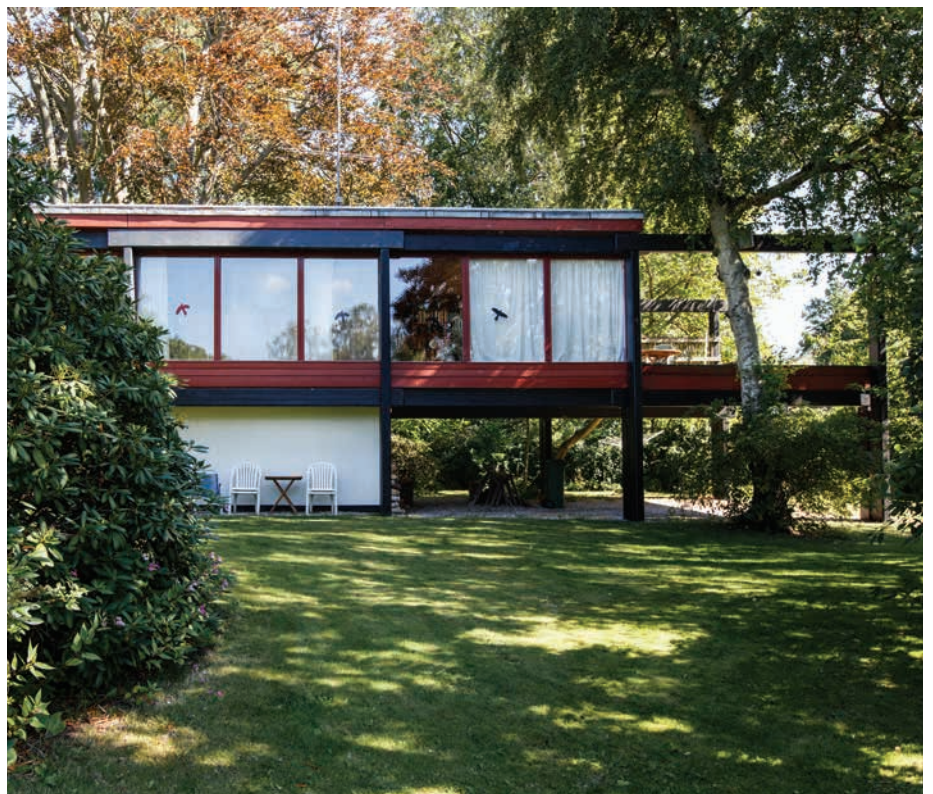
Parcelhus i Holte tegnet af Jørn Utzon