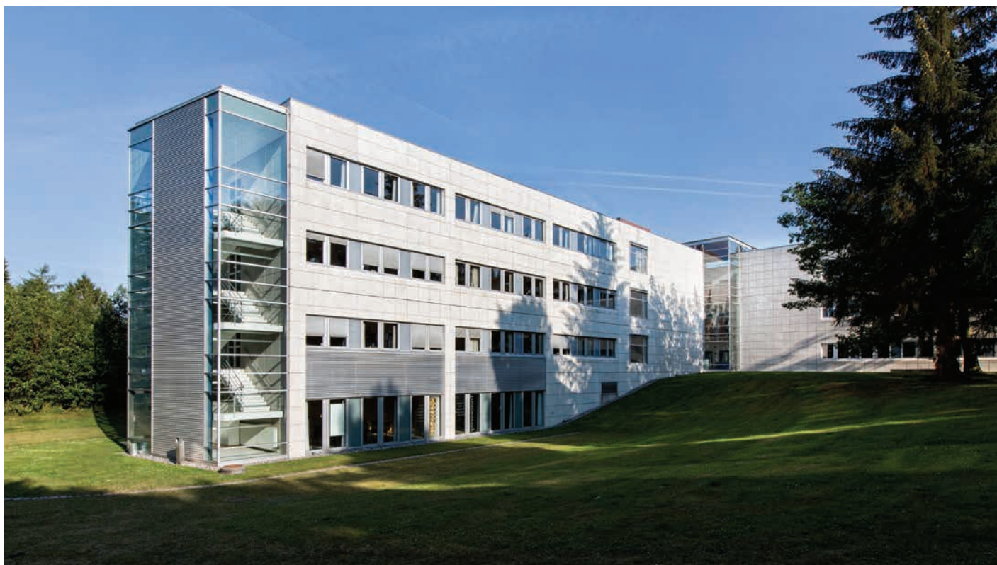
Bøge Allé 5 i Scion DTU tegnet af Cubo Arkitekter