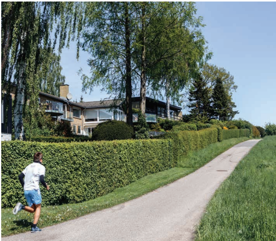
Turistvej i Bistrup

Kommunens landskab indeholder stor herlighedsværdi, hvilket har medført udvikling af sommerhusområder i Bistrup, Ravnsnæs, Ubberød og Brådebæk. I dag er områderne stort set konverteret til boligområder. Mange af områderne fremstår på trods af omdannelsen til boligområde stadig med et rekreativt præg.