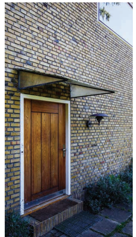
Detalje af hoveddør