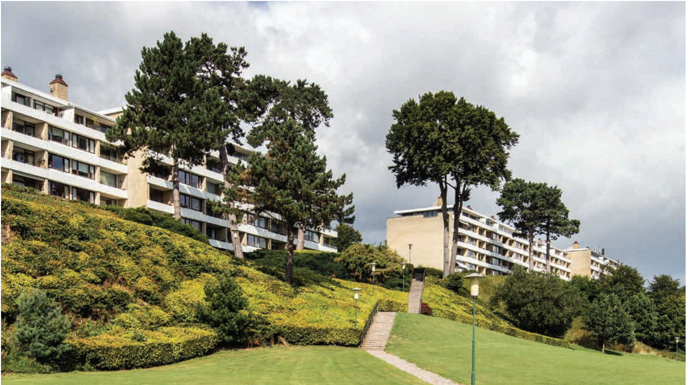
Høje Skodsborg tegnet af Jean Fehmerling