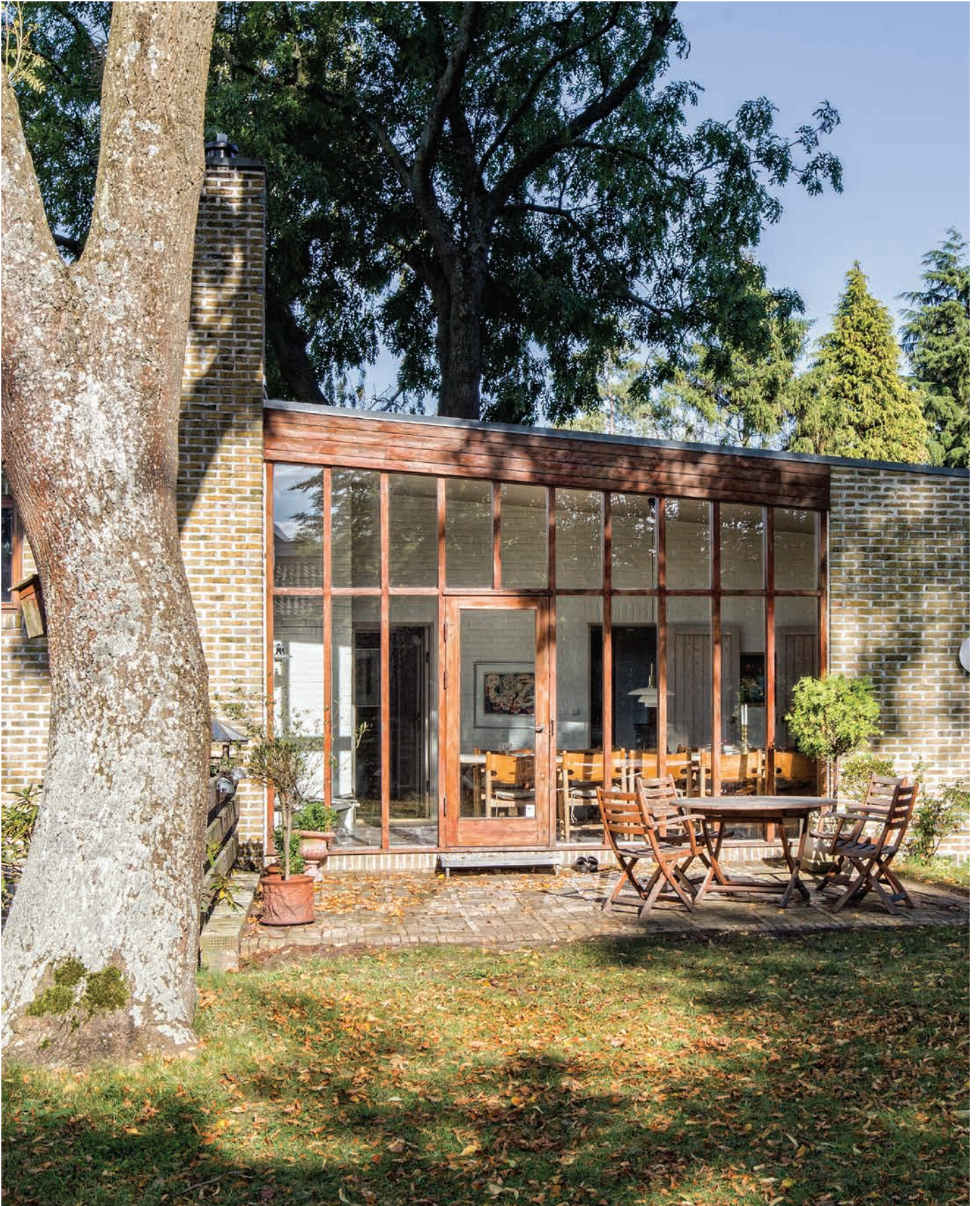
Villa i Skodsborg tegnet af Johannes Exner