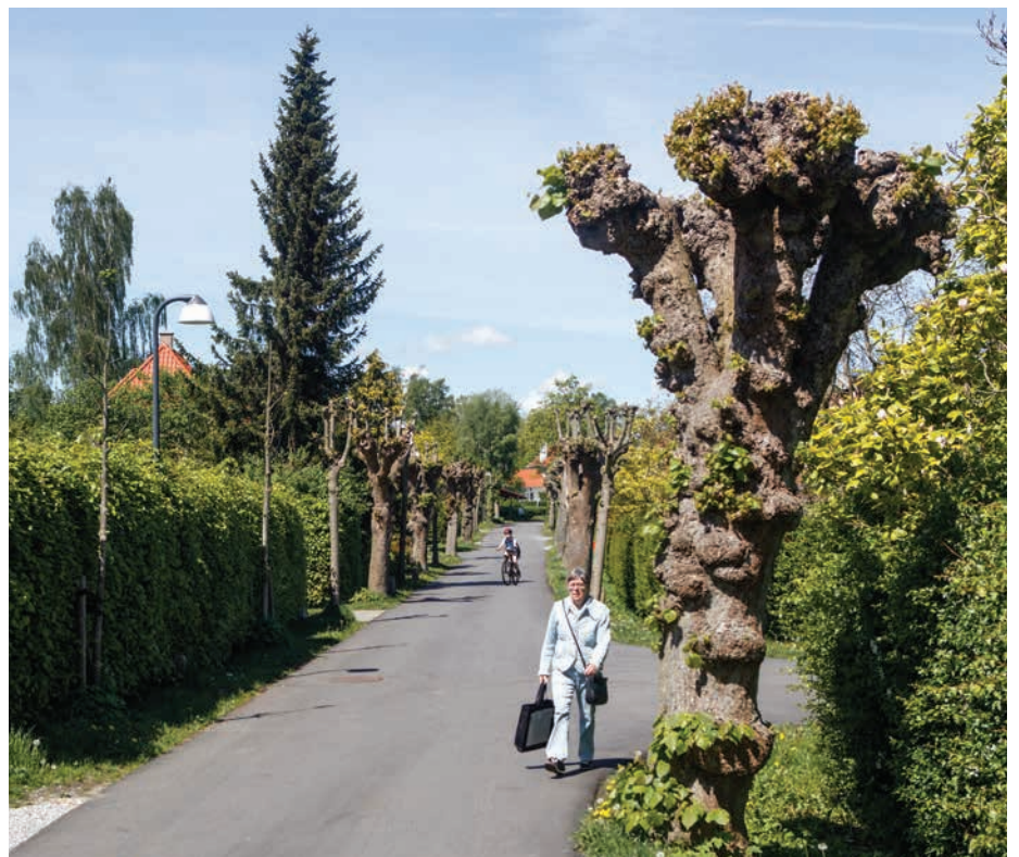
Lindevangsvej i Birkerød

Såvel forhaver som sammenhængende grønne områder tilfører ikke blot værdi til den enkelte boligejer, men præger oplevelsen af nærområdet og byen som helhed.