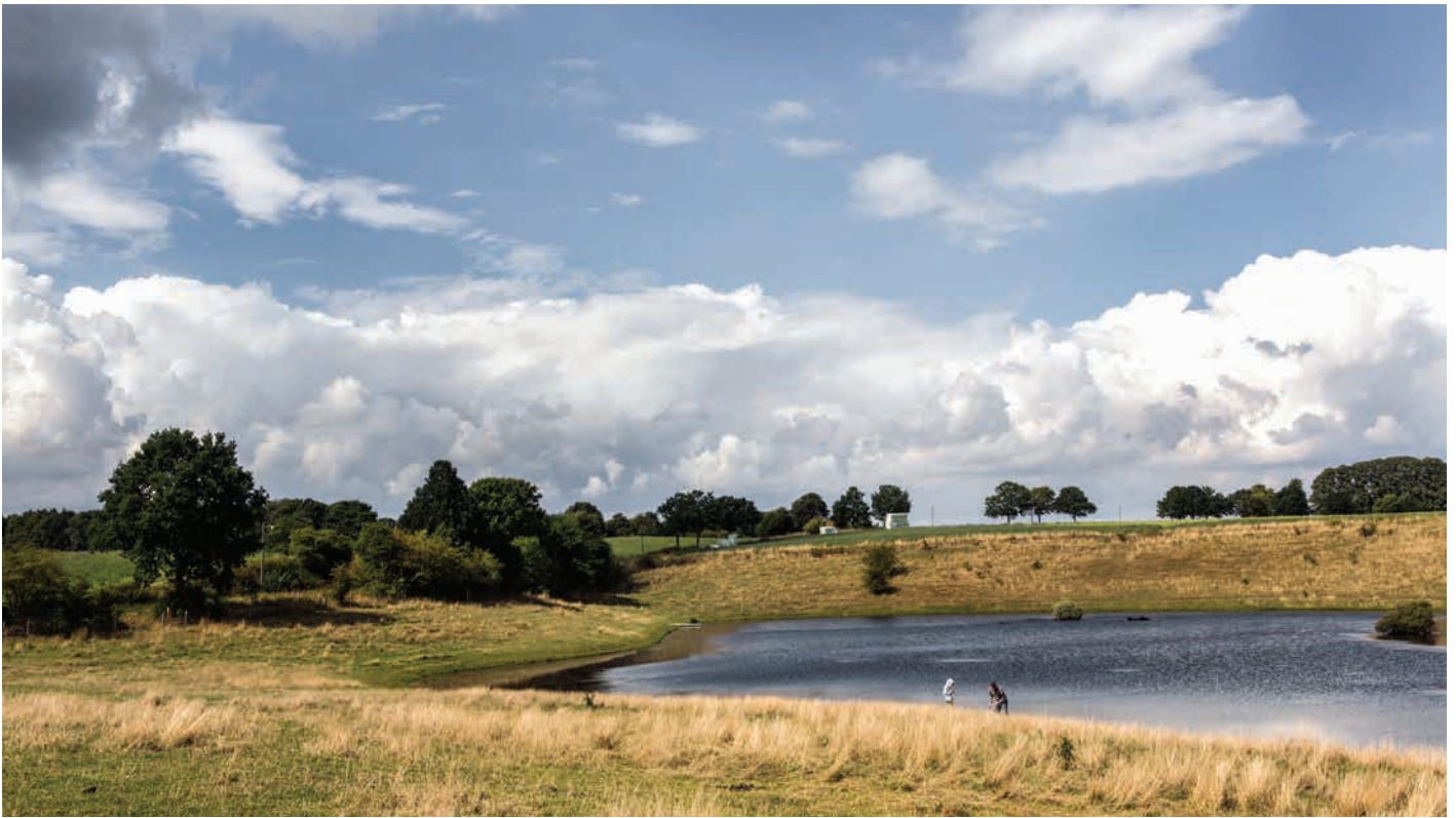
Fiskesø ved Attemosevej

valg er med til at understøtte om huset tilfører landskabet større kvalitet eller om huset lukker sig om sig selv, og først og fremmest er til glæde for ejeren.