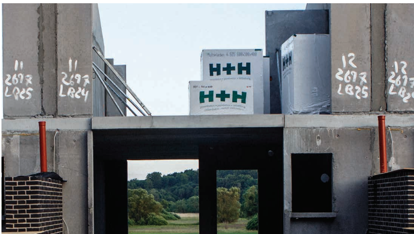
Nybyggeri på Henriksholm i Vedbæk