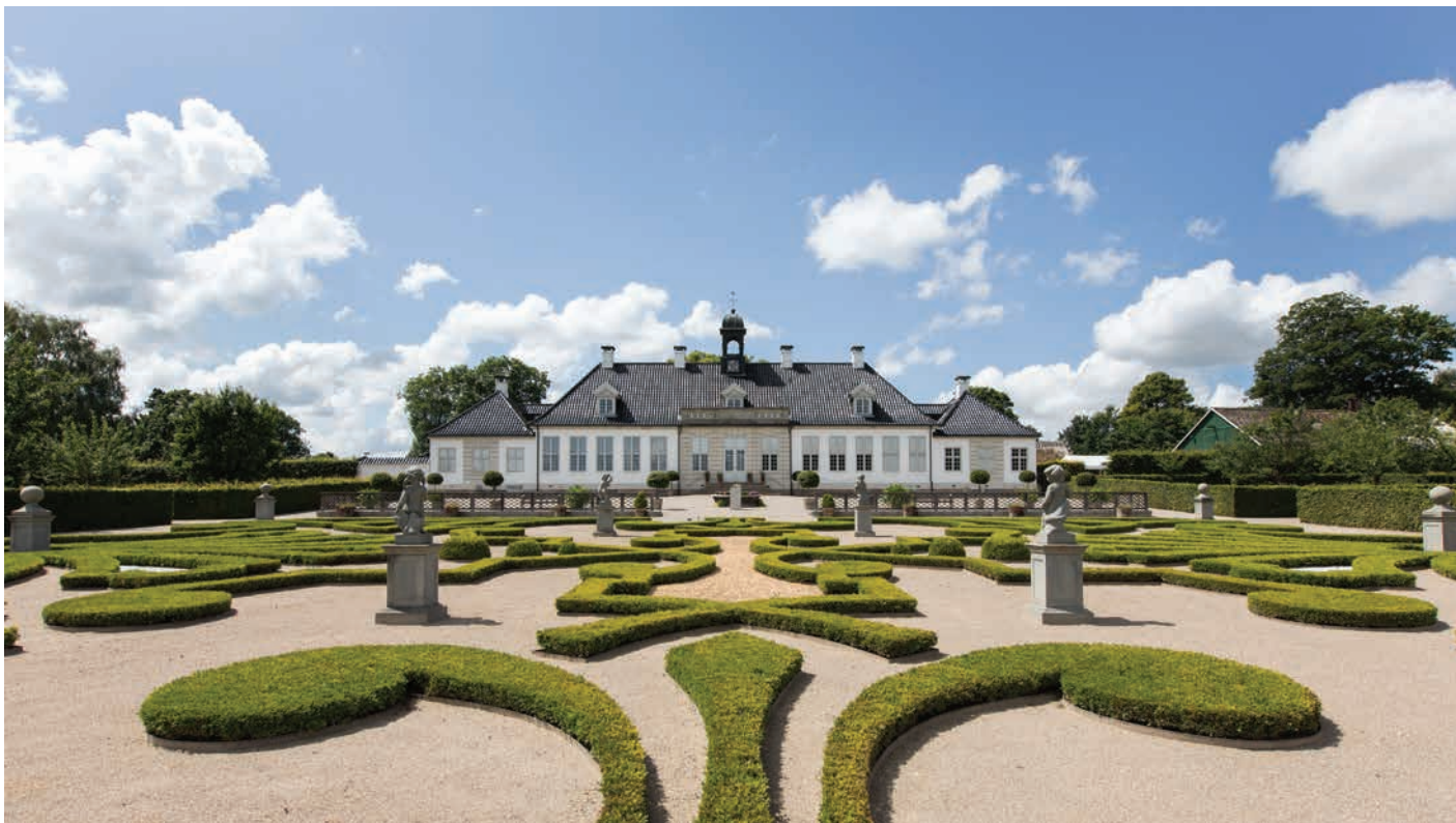
Gl. Holtegaard tegnet af Lauritz de Thurah

digt hus, vil der være specielt fokus på, at bygningens særlige arkitektur og bærende værdier stadig er tydelige eller tydeligere efter en til- eller ombygning. Detaljer skaber helheden og udformning af eksempelvis kviste, vinduer og døre kan være afgørende for bygningens fremtræden. Derfor vil der i sagsbehandlingen også være fokus på bevaring af bygningens unikke detaljer.