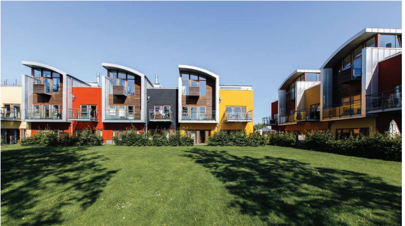
Pilehøj ved Birkerød Erhvervsby tegnet af Force 4