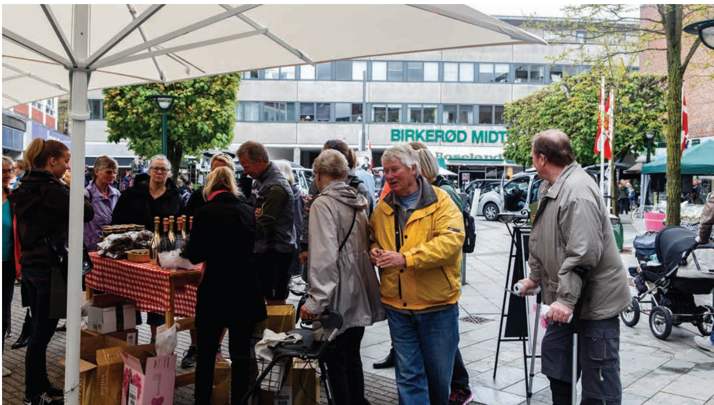
Torvedage ved Hovedgaden i Birkerød