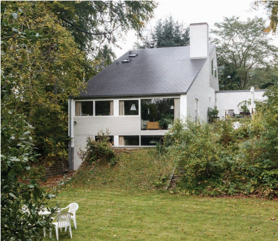
Énfamiliehus i Holte tegnet af Arne Jacobsen