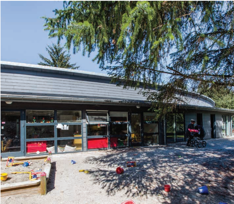
Børnehave i området Scion DTU tegnet af Saaby og Partners

Institutionsbyggeriet fra efterkrigstiden og frem repræsenterer et nyt pædagogisk tankesæt indenfor særligt skolebyggeri, som fortrinsvis udmønter sig i en campuslignende flad struktur med bevidst bearbejdning af inde- og uderum.