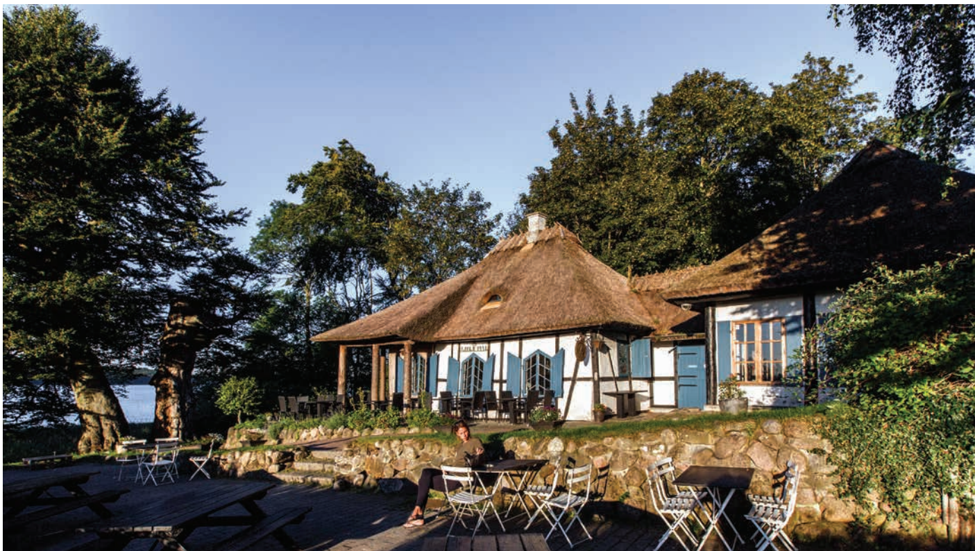
Jægerhytten ved Sjælsø