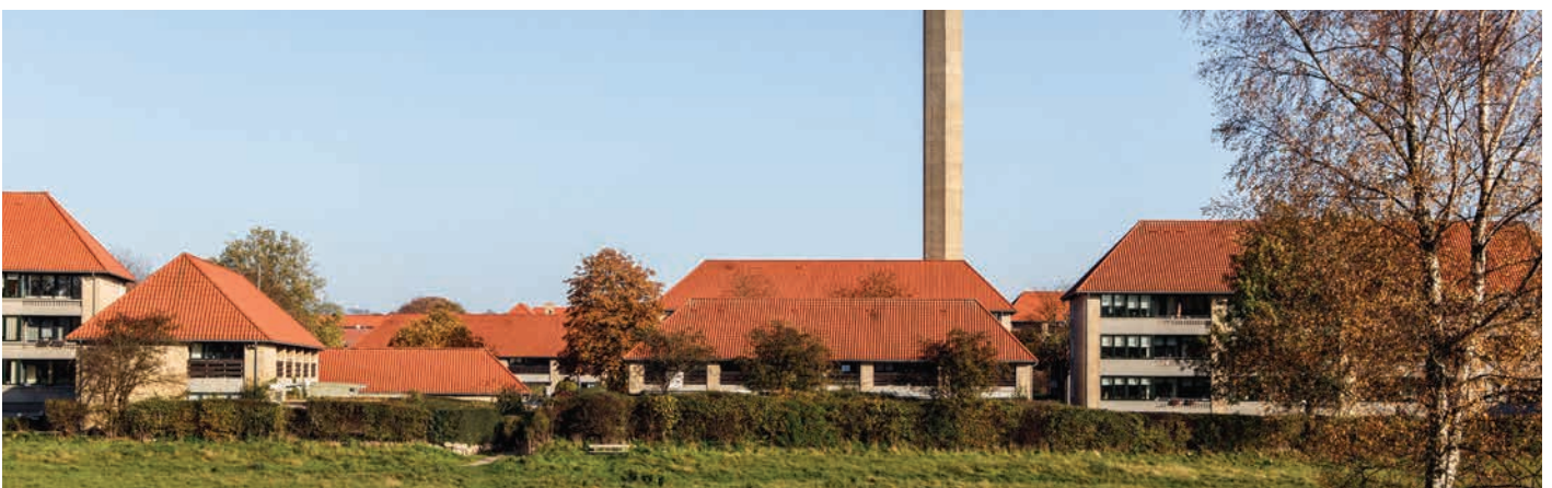
Nærum Vænge tegnet af Palle Suenson

Etageboliger giver mulighed for udsyn og plads til fællesskaber. Arkitektonisk tilfører de skala og fokuspunkter i byerne. Det gør det ikke mindre vigtigt, at de udarbejdes med omhu for helheden, linjerne, detaljen og i materialevalg.