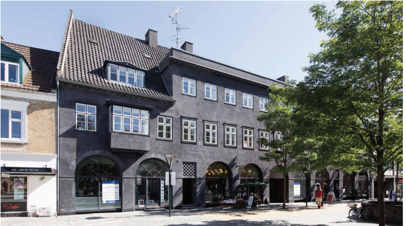
“Elefanten” på Hovedgaden i Birkerød