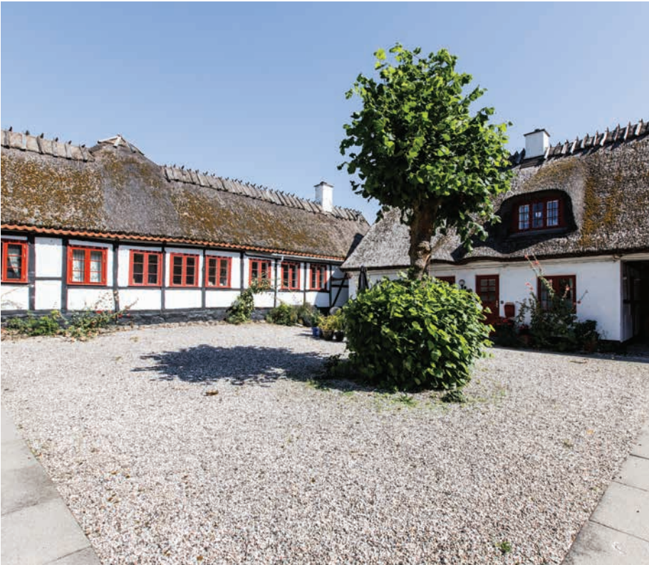
Gl. Bakkegård i Bistrup

Den nordlige del af Rudersdal Kommune har på grund af frodige jorder oprindeligt været et landbrugsmiljø.