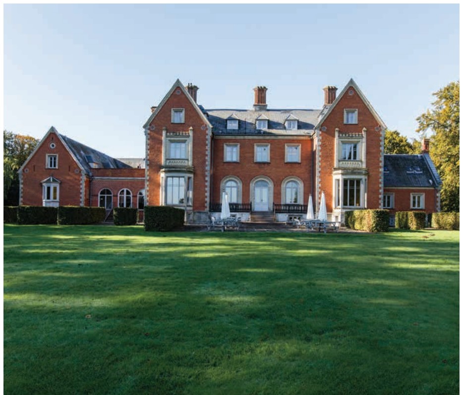
Enrum i Vedbæk tegnet af J.D. Herholdt

Såvel Næsseslottet som Enrum fremstår herskabelige og hovedhusene indeholder en klar symmetri. Begge landstederne indgår ligeledes i tæt samspil med det omkringliggende landskab.