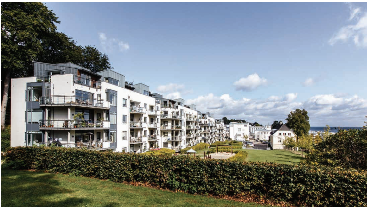
Hvide etageboliger i Skodsborg beliggende med udsigt til Øresund. Boligerne er tegnet af Arkitektgruppen i Århus