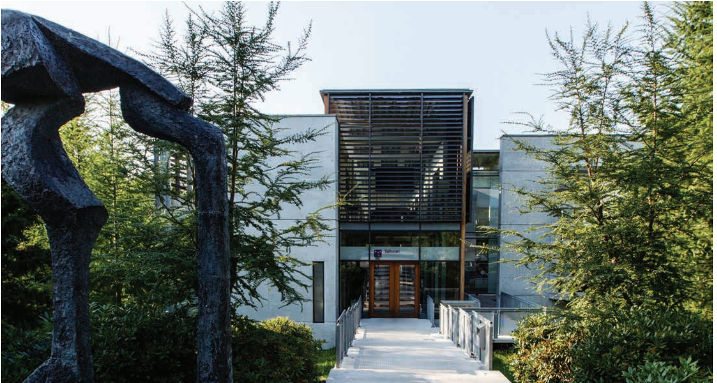
Søhuset i Scion DTU, Cubo Arkitekter