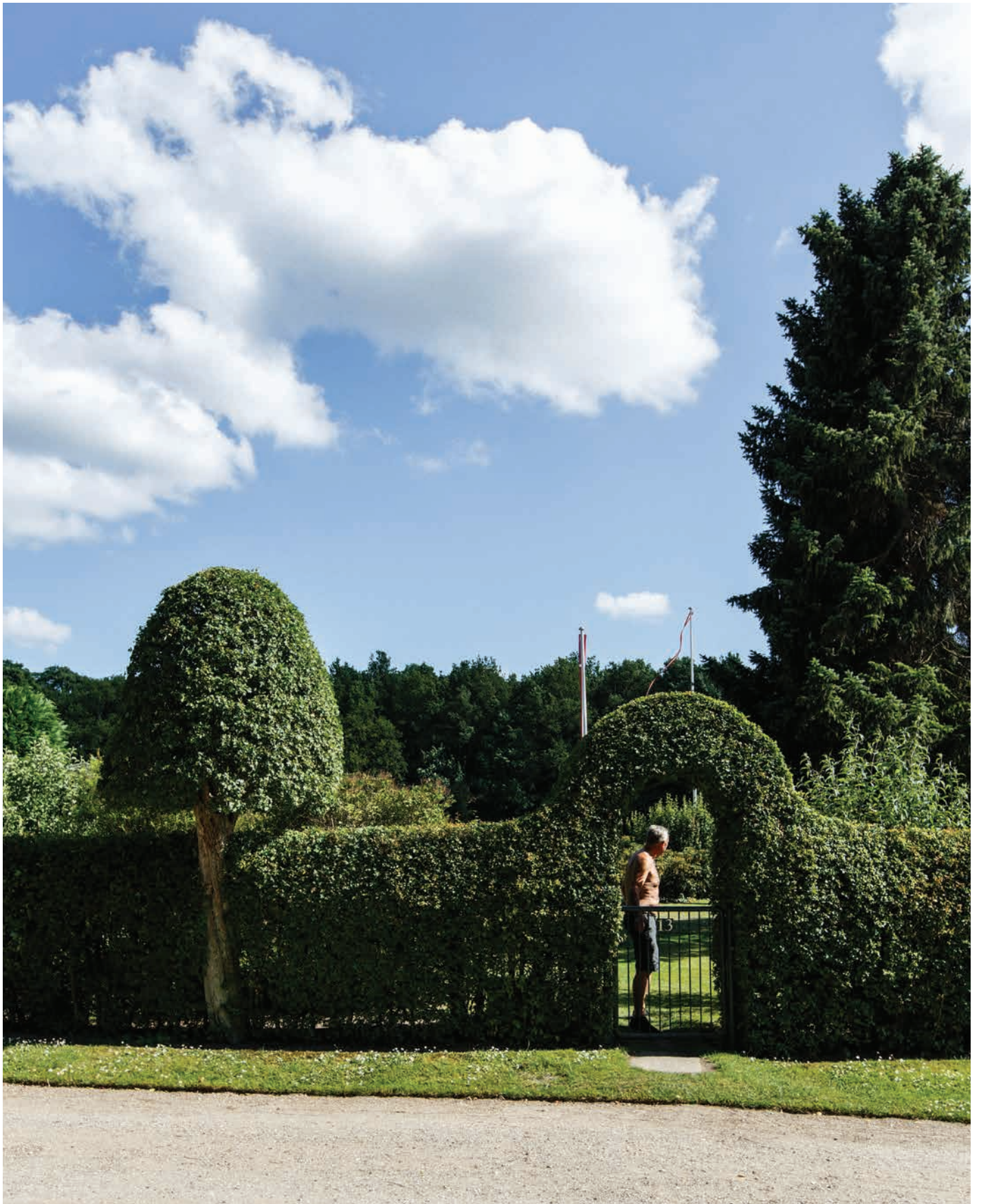
Kolonihavelod i De Runde Haver i Nærum