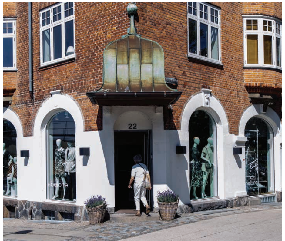
Butik på Holte Stationsvej

For begge bygninger gælder, at arkitekturen er skabt ud fra et ønske om det smukke udstillingsvindue og en inviterende arkitektur.