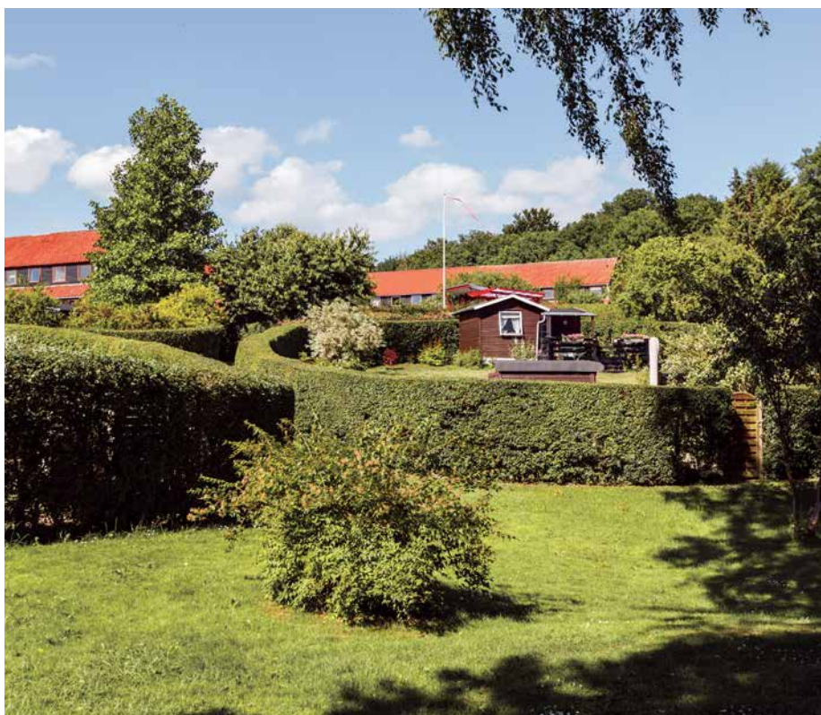
"De runde haver" i Nærum tegnet af C.Th. Sørensen

De runde haver i Nærum er et poetisk eksempel på, hvordan runde hække i samspil med ydmyge kolonihavehuse kan skabe et interessant og værdifuldt kulturlandskab.