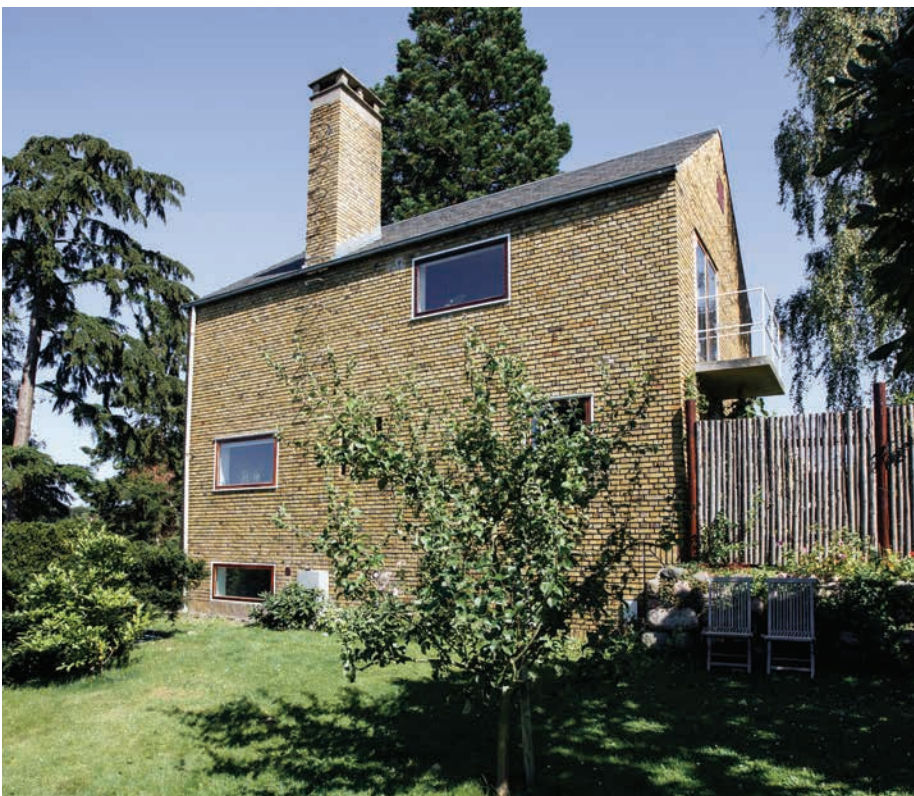
Énfamiliehus i Bistrup tegnet af Ernst Arntoft

Perioden fra 1925-1960 var præget af nedgangstider, krigens materialeman- gel og efterkrigstidens begrænsede muligheder i byggeriet.