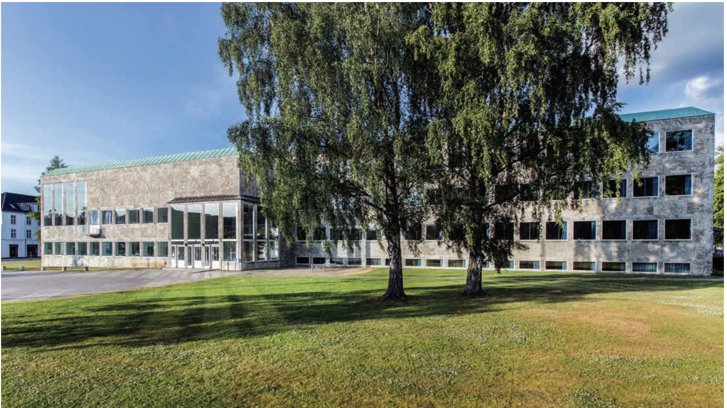
Rådhuset i Holte tegnet af Arne Jacobsen og Flemming Lassen