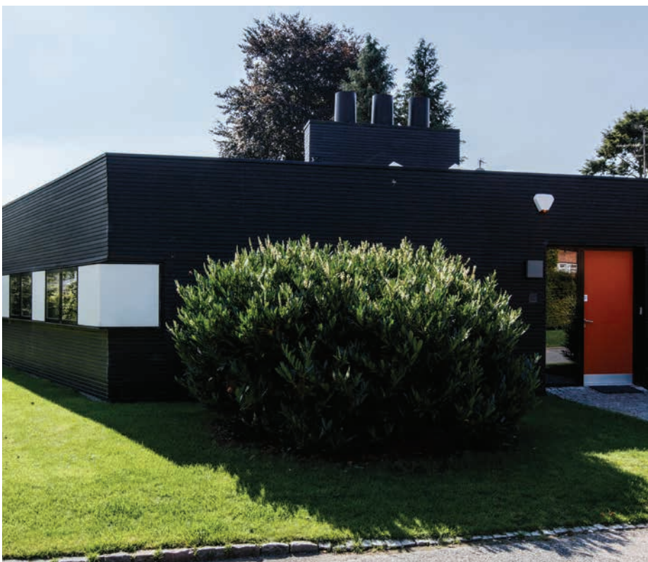
Parcelhus i Vedbæk tegnet af ONV Arkitekter

Om- og tilbygninger er med til at forny og udvikle boligen i takt med at den enkelte familie ændrer sig.