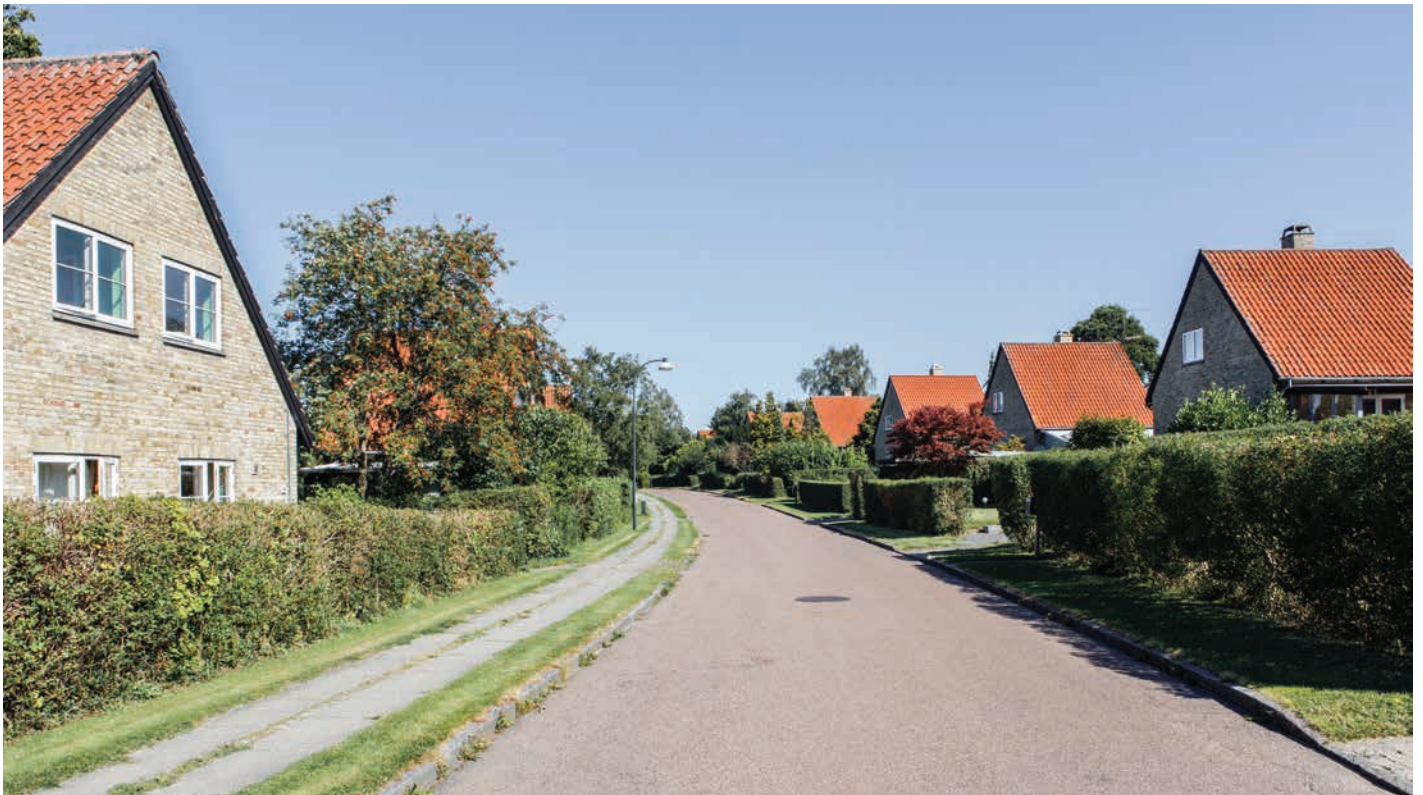
Solbjerg i Birkerød tegnet af Paul Marstrand