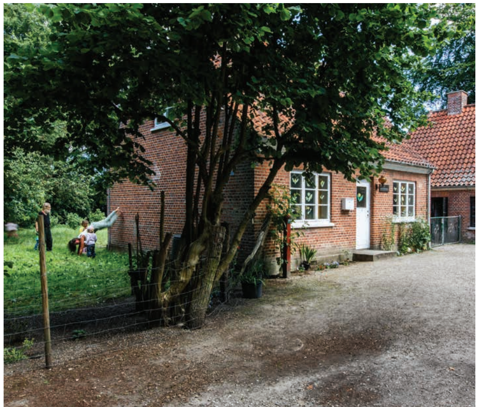
Skovløberhus på Bistrup Hegnsvej

Skovløberhuset på Bistrup Hegnsvej er et lille rødmuret hus i skoven. I dag anvendes huset til skovbørnehave.