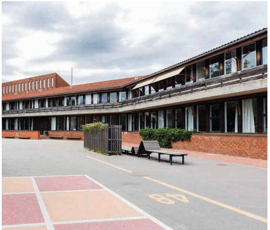
Toftevangskolen tegnet af Bornebusch, Brüel og Selchau

På hver sin måde fortæller de to bygninger også om deres tids forhold til læring og samlingssteder. Hvor Toftevangsskolen er ydmyg, så fortæller Nærum gymnasium med stolthed om sin betydning.