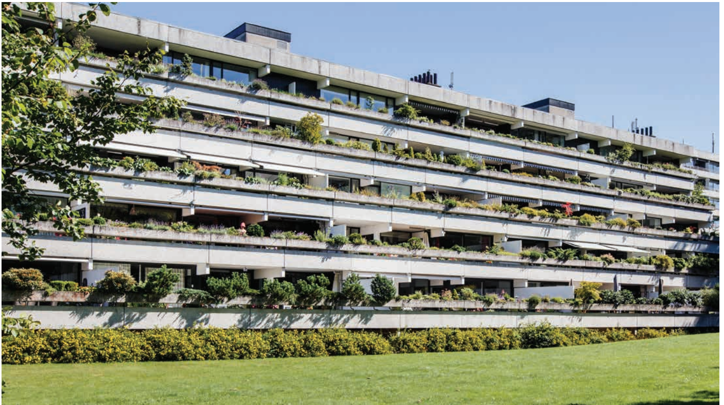
Vejlesøparken i Søllerød tegnet af Ole Hagen