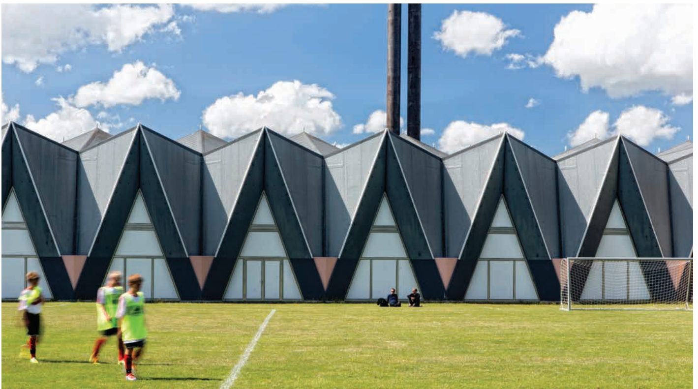
Rundforbihallen tegnet af Ole Helveg og Claus Bremer

Den grønne identitet og bevaring af vores kulturmiljøer og bygningsarv er det, som giver retning og mening i arbejdet for Rudersdal Kommune som værende "tæt på - og meget grønnere".