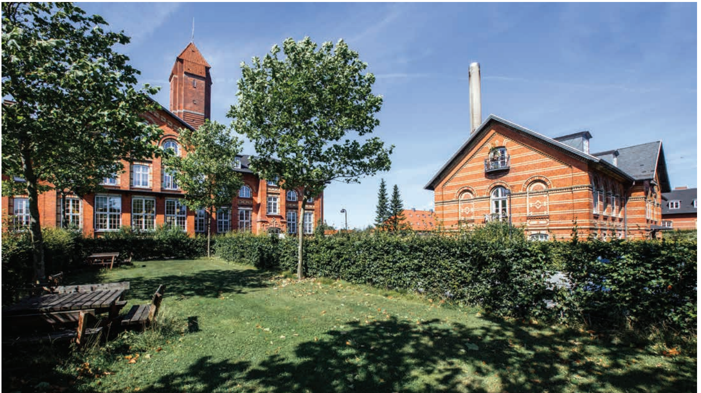
Det centrale Ebberød tegnet af Georg Wittrock