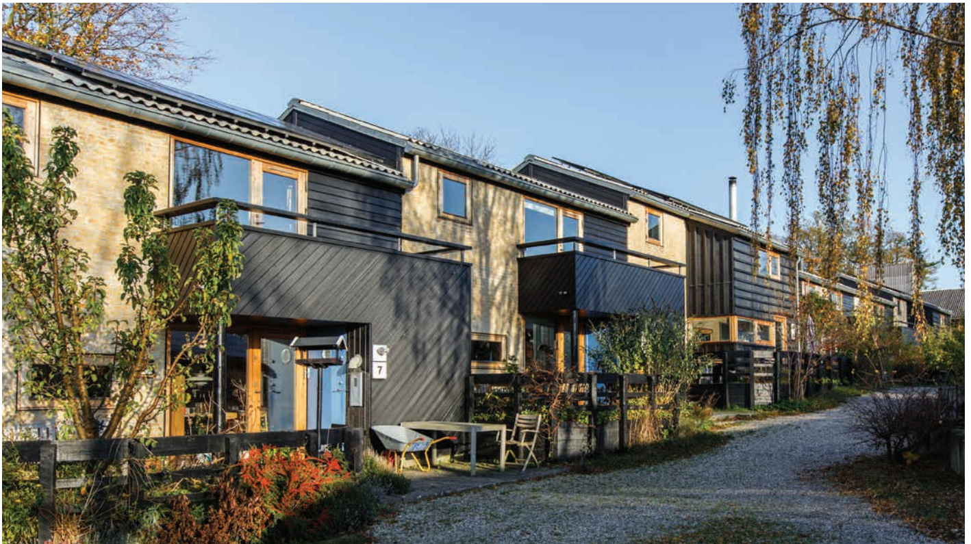
Trudeslund i Birkerød tegnet af Vandkunsten