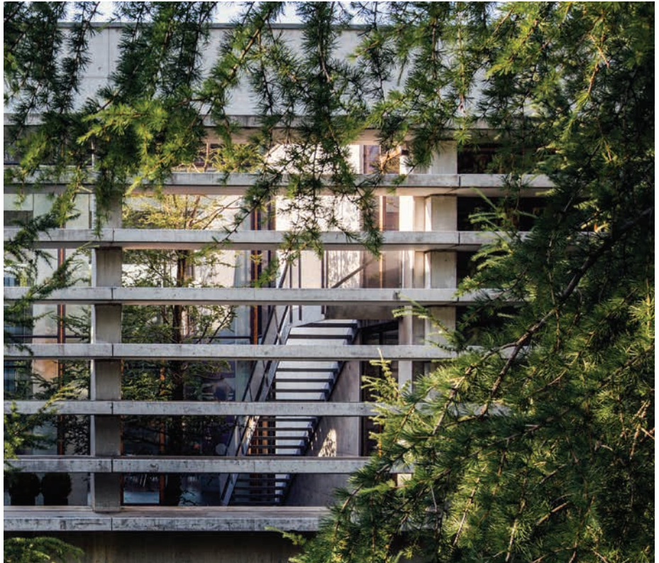
Søhuset Scion DTU

Murværk kan fremstå meget varieret, alt afhængigt af hvordan fugen møder mursten og hvordan de enkelte sten er placeret i forhold til hinanden. I Nærum Vænge er der med buede ventilationsriste nær soklen skabt en fin detaljering. Samtidig gentager den gule mursten sig i belægningen og bidrager til en meget helstøbt bebyggelse.