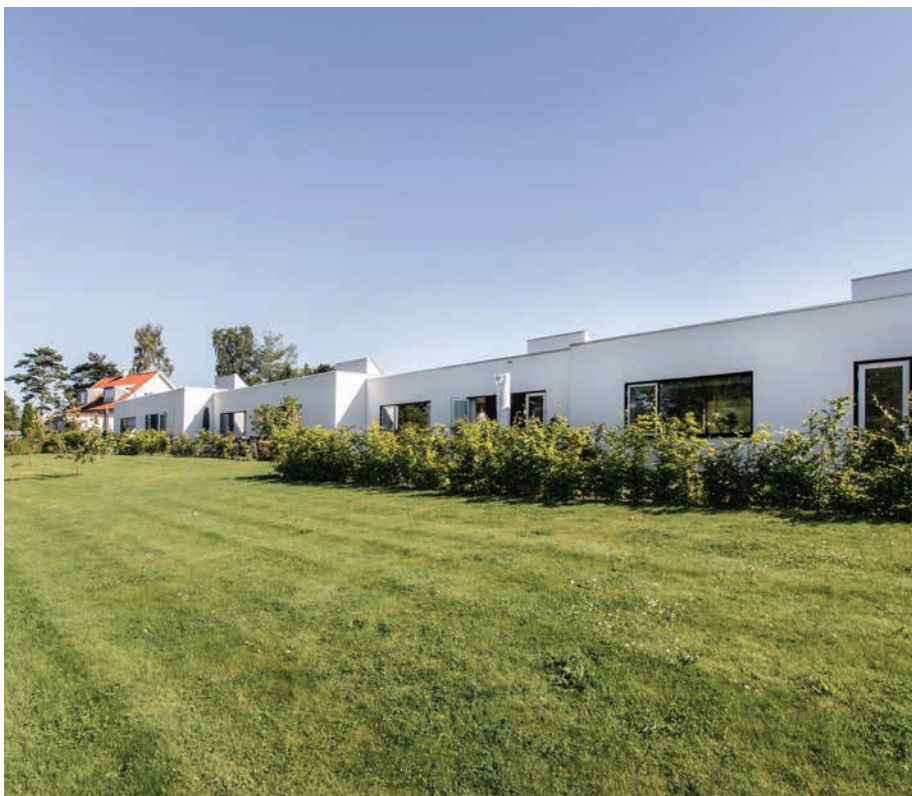
Gårdhavehuse ved Nærumgårdsvej. Gårdhavehuse er tegnet af Lind og Risør

I Rudersdal er flere erhvervsområder gennem de seneste år konverteret til boligområder.