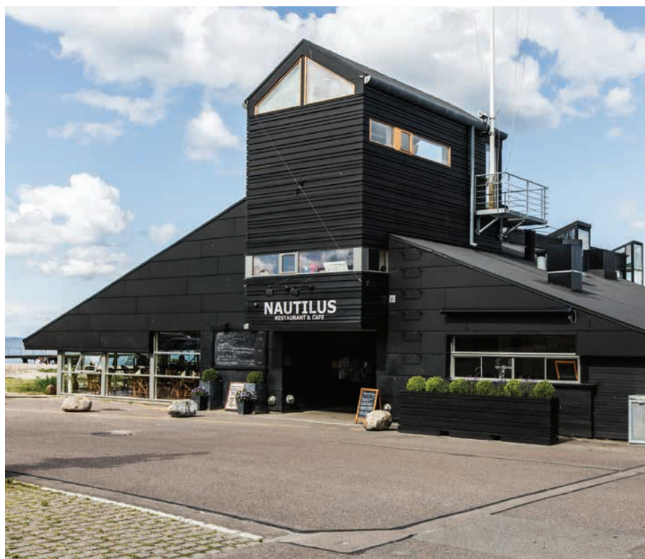
Det maritime klubhus på Vedbæk Havn tegnet af Vandkunsten

Vedbæk og Skodsborg er skabt ud fra kysten som levested og attraktion. Det opleves i form af spor fra tidlig fiskeri og badebystemning. Samtidig er der en tydelig orientering af bebyggelse mod kysten.